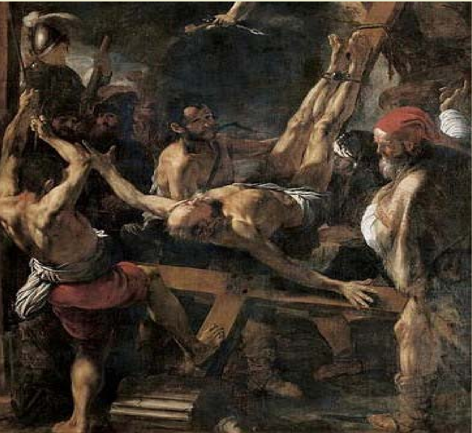
Caravaggio, Luca Giordano, Masaccio, Mattia Preti.

Quindi, come precisa S. Giovanni nel passo citato, si ebbe la sostituzione e la nascita ufficiali del personale “Pietro” (“vocaveris Cephas, quod interpretatur Petrus = ti chiamerai Cefa , il che vuol dire Pietro”; così anche Luca VI, 14: “elegit...Simonem quem cognominavit Petrum = scelse...Simone, che chiamò Pietro”), nome che poi nelle molteplici varianti linguistiche ha ricevuto larghissima diffusione in Europa grazie al culto attribuito al santo principe degli apostoli, sepolto nell’omonima basilica di Roma.