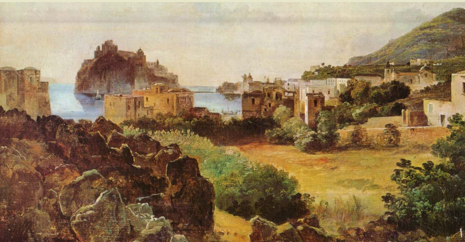
Antonio Pitloo (1790-1837)

Da nchiuvá a gnuvá , da nchiummá a gnummá , da nchiurere a gnurere : vedi -02- La consonante - C -; paragr. 10- Mutazione NC/GN-.