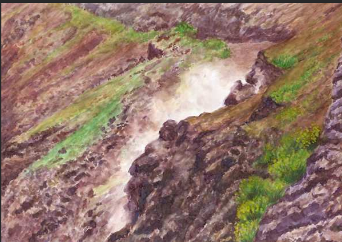
“Fumarole nel cratere del Vesuvio”