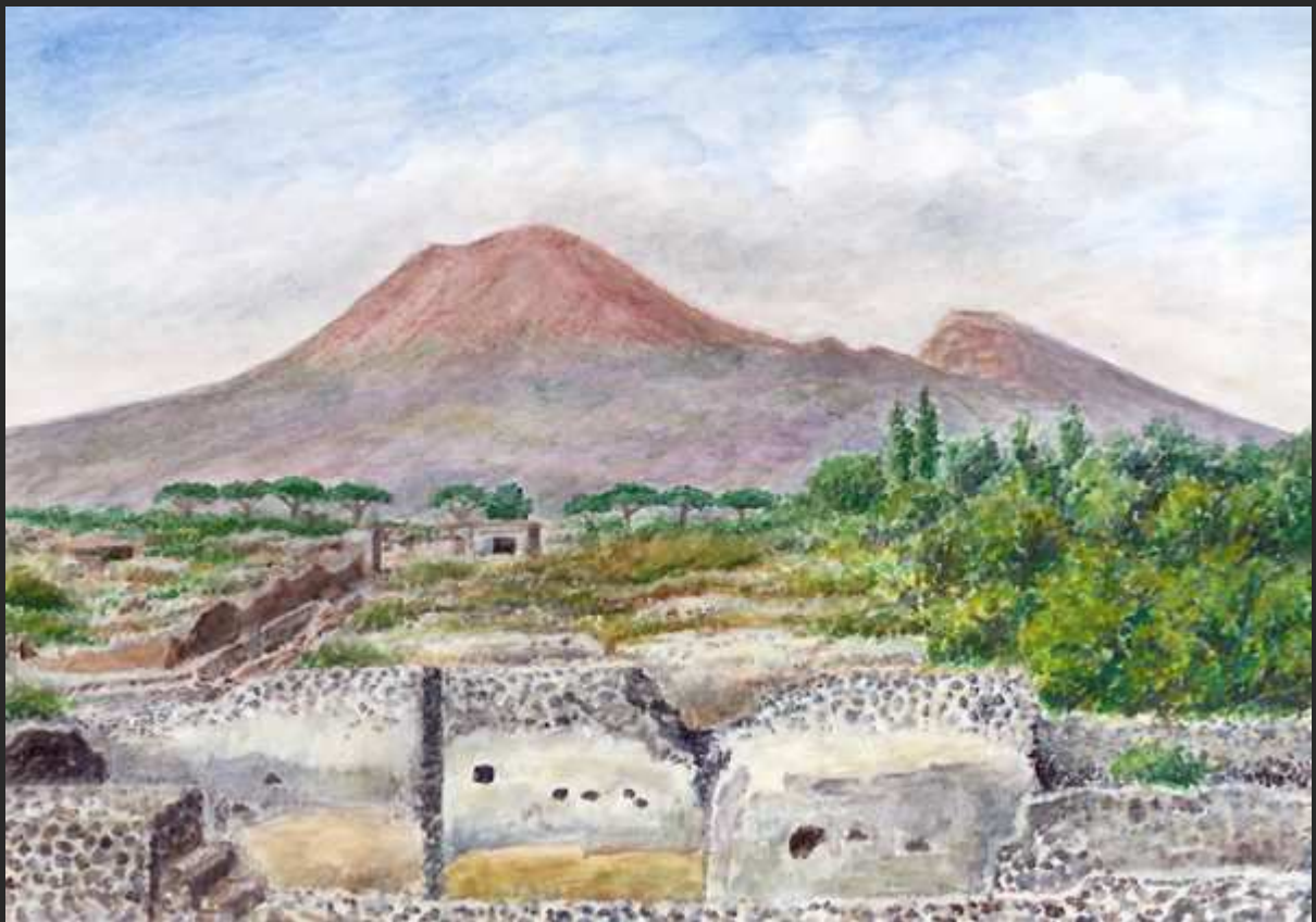
“Pompei e Vesuvio”