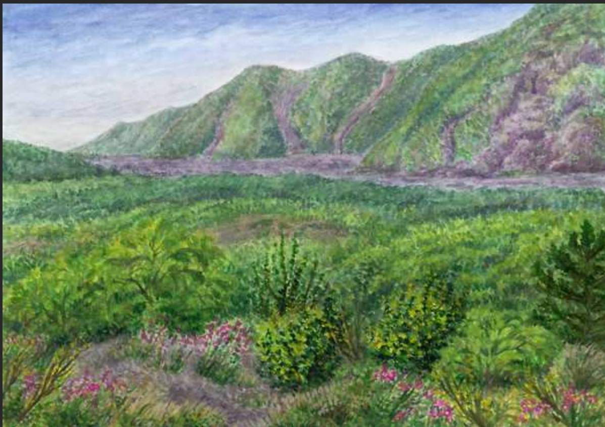
“Piante sulla lava Vesuvio e Monte Somma “