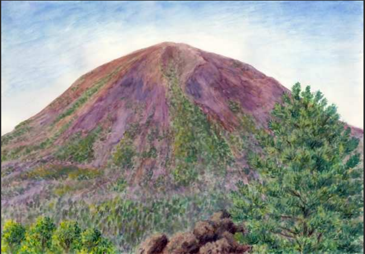
“Piante sulla cima Vesuvio “