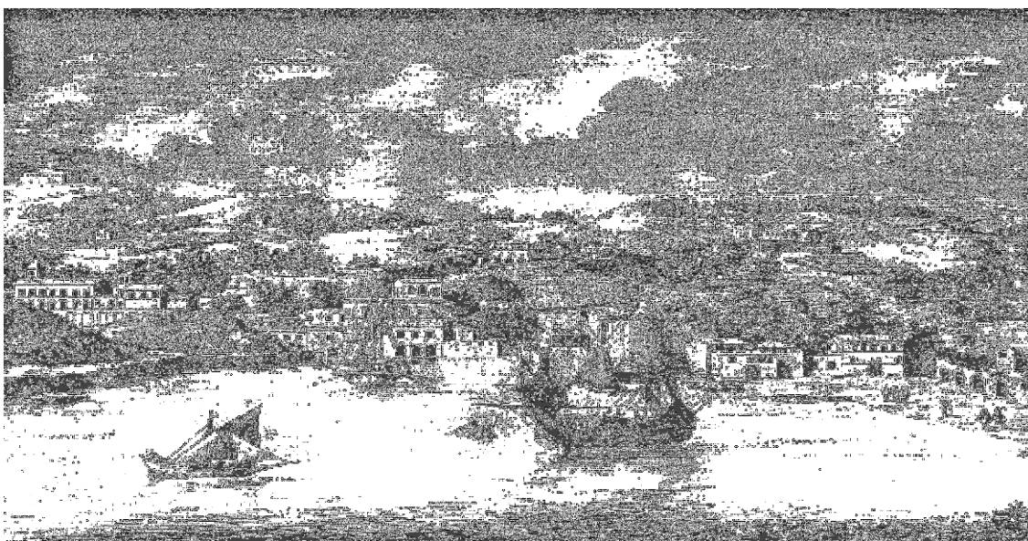
Figura 2, Pausilypon Prospectus incisione del 1640, Pieter Van der Aa, Amoenissimus, (D.Viggiani, 1989).