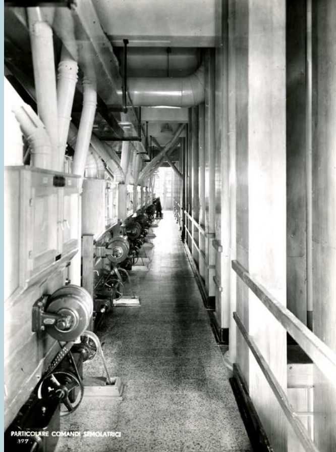
2.5 - Particolare comandi semolatrici.

All'ultimo piano erano situati i "plansichter" 3 , che avevano la funzione di dividere il grano ormai macinato in base alle diverse dimensioni dei prodotti macinati.