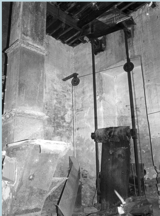
2.2 - Collettore grano-elevatore.

Il silo era collegato con i locali della pulitura tramite una galleria sotterranea di dodici metri; il trasporto del grano, in questa altra fase del processo, avveniva per mezzo di una coclea (la cosiddetta vite di Archimede). Per facilitare il servizio furono impiantate nella pulitura stessa altri quattro cassoni per grano della capacità lorda di circa 1000 q.li ognuno, due per grano tenero e due per grano duro; questi cassoni ricevevano il grano, pesato nel silo e servivano da deposito alla pulitura propriamente detta.