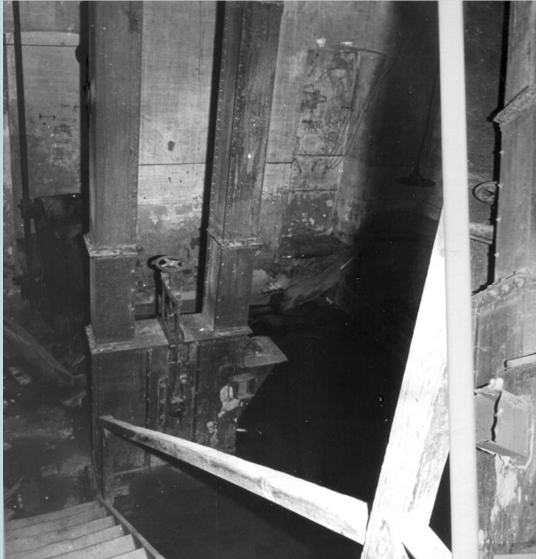
2.4 - Base elevatore.

Al terzo piano furono collocate tutte le pulitrici da semola a vento aspirante, tanto per il molino a grano duro, che per quello a grano tenero.