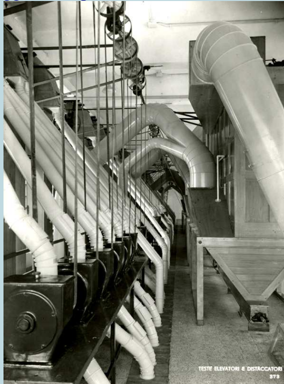
2.6 - Testa elevatori e distaccatori.

A questo punto scivoli dritti ed elicoidali convogliavano i sacchi con il prodotto finito o sui carri oppure tramite un trasportatore a nastro sulle imbarcazioni ormeggiate nel porto.