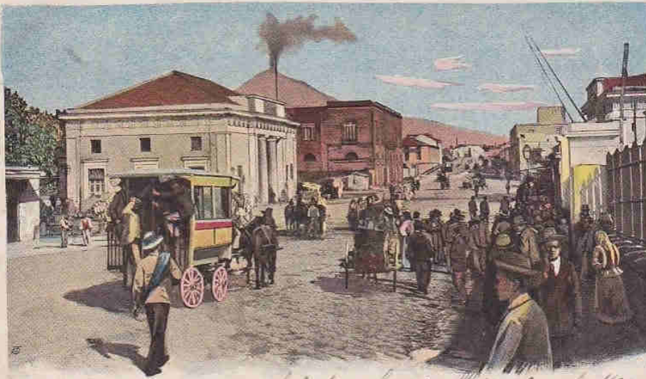
289 - NAPOLI - Ponte della Maddalena. Saluti e vari affetti a tutti G. P.