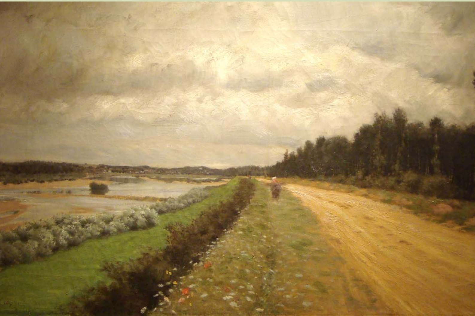
Giuseppe De Nittis (1846 – 1884)

Nella zona campana, poi, addirittura la parola si fossilizzò nel significato di “la stagione per eccellenza = l’estate”, epoca non di semina ma di maturazione di alcuni frutti tipici; cfr. italiano “stagionare” = maturare.