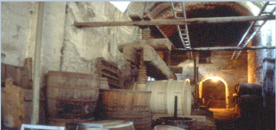
Torchio della Masseria Rota - Cercola - Area Somnese

In comunicazione o compreso nel Cellaio, era lo strettoio, locale così definito per il fatto di contenere il torchio impiegato per la prematura delle vinacce.