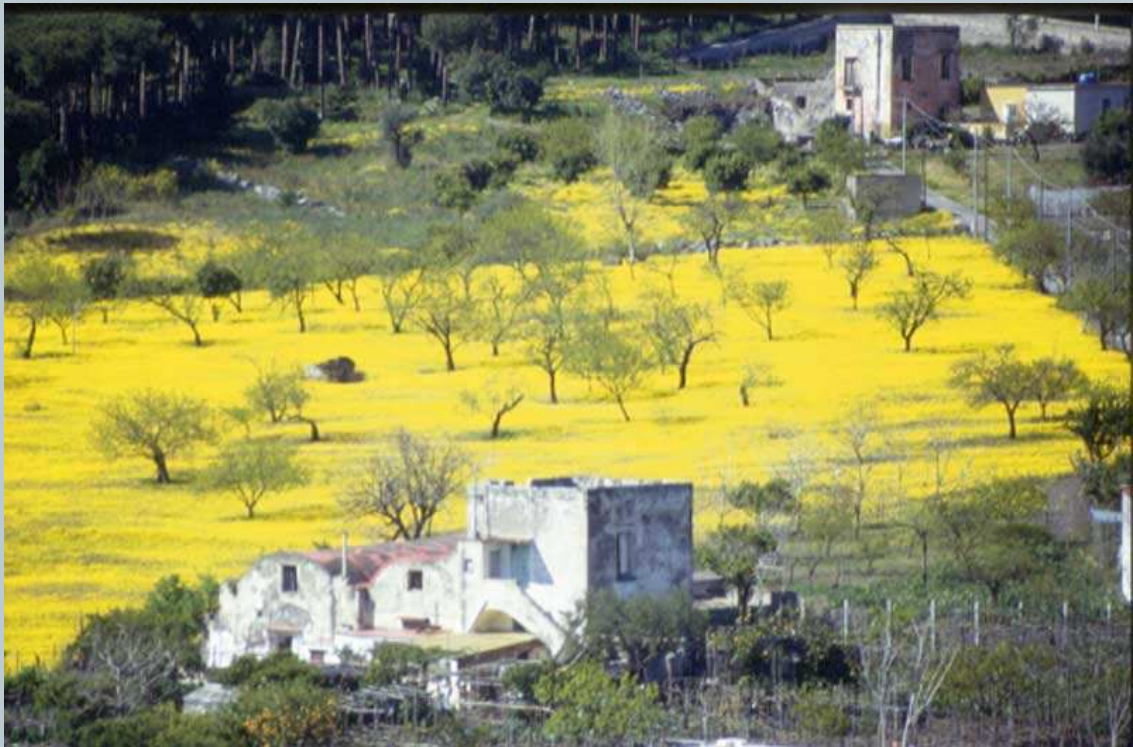
Fabbricati colonici di Via Viulo - Torre del Greco – Area Vesuviana

Tutta l'area vesuviana è stata caratterizzata, sino a circa la prima metà del XIX secolo, da una struttura territoriale basata sul latifondo. 1 Quest'ultimo si raccoglieva attorno alla masseria padronale ed era disseminato di case coloniche. 2