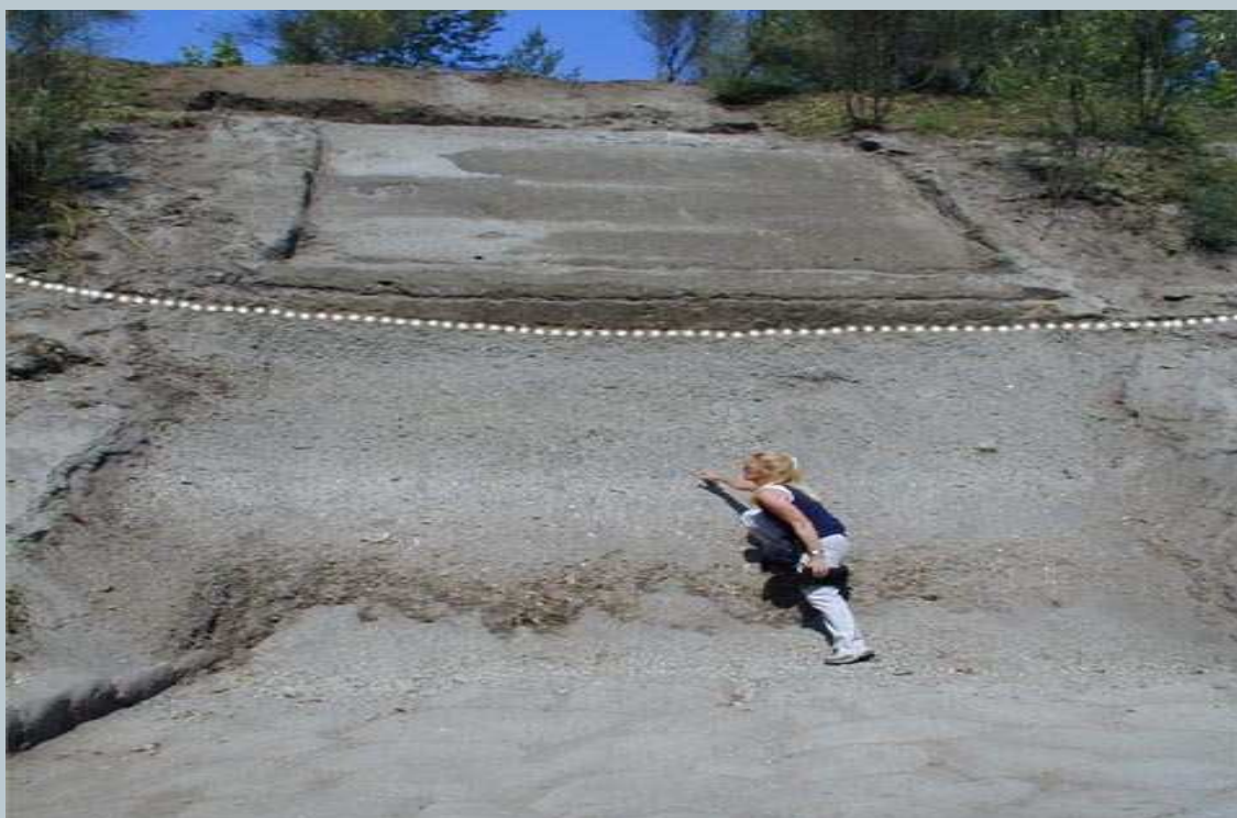
Cava di pomici. Depositi come questi erano utilizzati per cavare la materia prima per l'impermeabilizzazione di solai e volte di copertura delle masserie vesuviane.

Anche per l'impermeabilizzazione dei solai e delle volte di copertura si ricorreva a materiale reperito nell'immediato circondario dell'edificio da edificare. La tecnica era nota come battuto di lapillo e consisteva nello stendere sull'estradosso delle volte da impermeabilizzare uno strato di pomici fini mescolate con calce. Dopo aver messo in opera lo strato impermeabilizzante quest'ultimo veniva battuto per ore con delle apposite assi sino a far penetrare il latte di calce in tutti i vucooli, ancorché infinitesimali, che compongono la struttura porosa delle pomici. Particolare attenzione andava inoltre prestata alla temperatura dell'aria, e all'umidità relativa, presente al momento della realizzazione del manto impermeabile. Troppo caldo o un'aria troppo secca avrebbero asciugato rapidamente il manto impermeabilizzante, con conseguente formazione di micidiali crepe ... per questo motivo tra muratori e carpentieri vigeva il detto fraveca 'e vierno fraveca 'e fierro (costruzioni fatte d'inverno ... costruzioni di ferro).