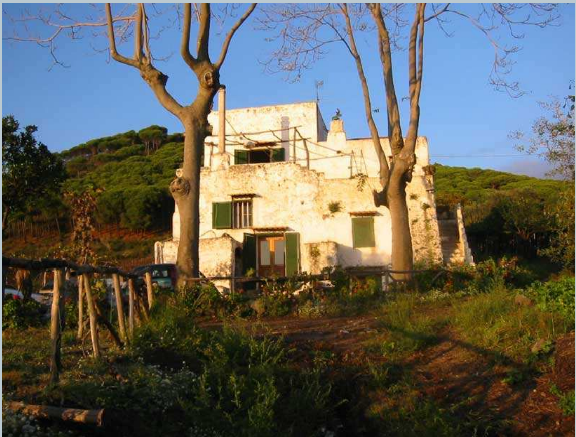
Fabbricato rurale in località Monticelli - Torre del Greco - Area Vesuviana

Le prime sono sopravvissute in numero piuttosto limitato, sia a causa delle cicliche e devastanti colate laviche originatesi dal vulcano (che non investivano il versante opposto a causa dalla difesa naturale costituita dal crinale del Monte Somma), sia a causa delle altrettanto devastanti colate di cemento generate dall'uomo (anche il cemento si è riversato ... con maggiore intensità sul versante costiero più appetibile per le note emergenze paesaggistiche).