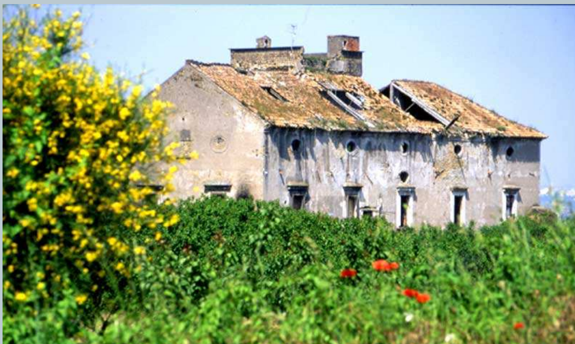
Masseria Rota – Cercola – Area Sommese

E' questa l'area dove ancora oggi si conservano grandi edifici monumentali circondati da ciò che resta degli antichi latifondi. Si tratta di un patrimonio cospicuo in gran parte abbandonato ma ancora recuperabile che rimane invece colpevolmente abbandonato all'incuria e ai danni provocati dal trascorrere del tempo.