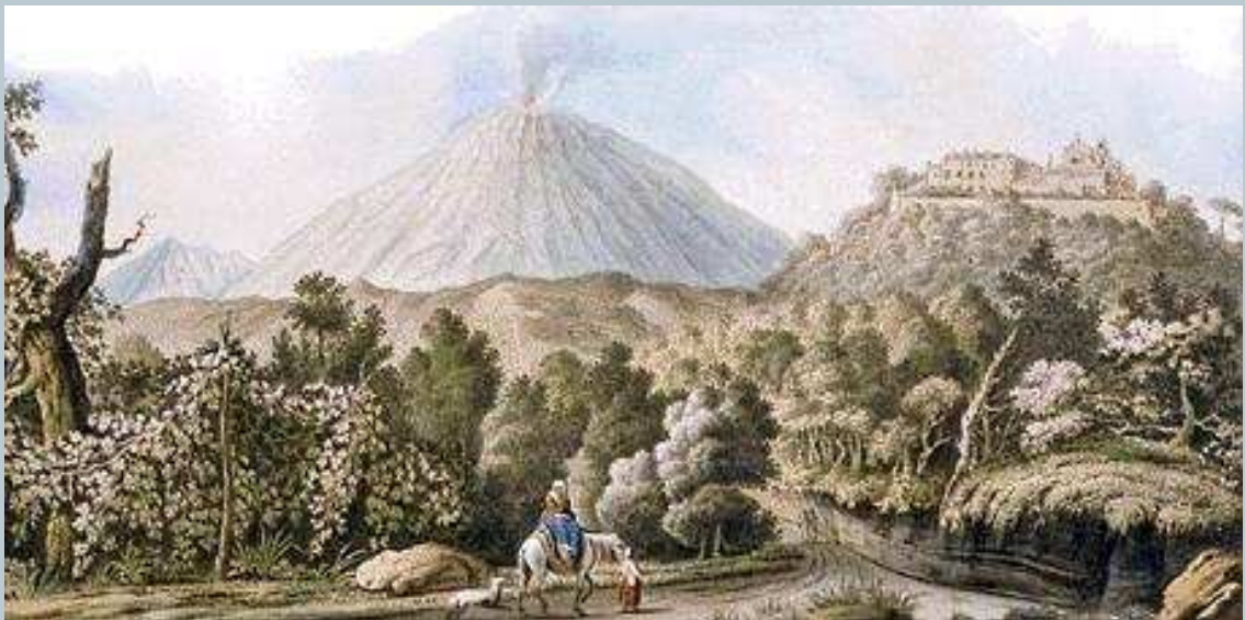
Campagna vesuviana nei pressi dei c.d. Camaldoli della Torre (Torre del Greco)

Le conseguenze di questa dimenticanza sono molto gravi e si estrinsecano nel pressoché annichilimento del patrimonio rurale vesuviano con pochissime emergenze architettoniche sopravvissute, più perché sede di nuclei familiari indigenti, sforniti di adeguate risorse finanziarie per ... trasformarle in cubi di cemento, piuttosto perché qualcuno si sia mai preoccupato della loro tutela.