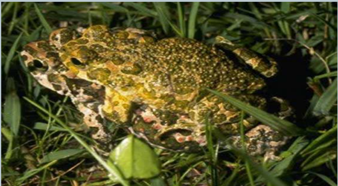
Un'oramai rara immagine di Rospo Smeraldino fotografato nella Valle dell'Inferno tra il Gran Cono del Vesuvio e il Monte Somma.

Anche i campi coltivati erano disseminati di cisterne a pozzo e piscine all'aperto che, tra l'altro, davano ricettività all'oramai quasi estinto rospo smeraldino. In assenza di stagni naturali il rospo smeraldino ha infatti conosciuto analogo declino, rispetto a quello delle strutture edilizie che lo accoglievano, ed oggi è quasi scomparso dalle campagne vesuviane.