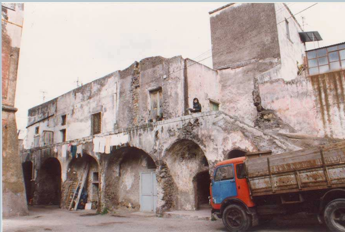
Torretta Fiorillo - Località Santa Maria La Bruna – Torre del Greco- Area vesuviana

L'attività di cava del materiale da costruzione, all'interno dello stesso perimetro entro il quale si sarebbe successivamente edificato il nuovo edificio, comportava spesso la perforazione della bancata lavica ... da questa situazione derivavano altri vantaggi. Il foro nella bancata lavica era trasformato nella porta d'ingresso della cantina e la stessa colata, scavata nella parte sottostante, si trasformava in un comodo e tenace solaio per gli ambienti ipogei così ottenuti (c.d. grotta del vino ). Tutto ciò che si estraeva per creare la grotta del vino era pur sempre lapillo ...trasformabile in altra pozzolana.