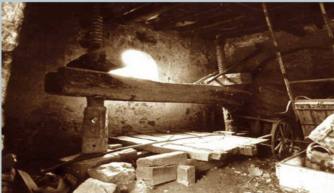
Un esempio di torchio a doppia vite

Coerentemente con gli spazi che li ospitavano i torchi sommesi (anche definiti strettoi o cercole), assumevano non di rado dimensioni ciclopiche (la sola trave principale del torchio arrivava a misurare sino a 12 metri di lunghezza, per più di uno di spessore). 4