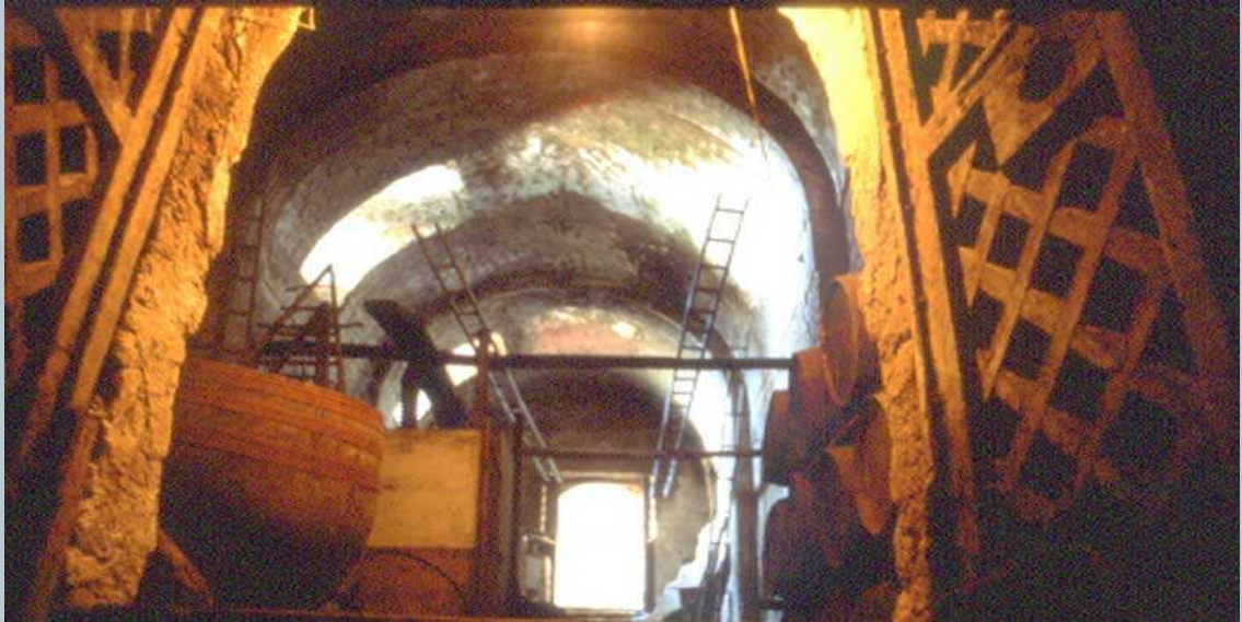
Porta di comunicazione tra Cellaio e Cantina Masseria Rota - Cercola - Area Somnese

Nel Cellaio si collocavano i tini destinati ad accogliere il frutto della prematura dell'uva. Poiché durante la fermentazione alcolica si sviluppava una grande quantità d'anidride carbonica, il Cellaio doveva essere spazioso e molto aerato ed inoltre rivolto a mezzogiorno perché il calore favorisse il processo di trasformazione degli zuccheri in anidride carbonica ed alcool.