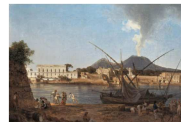
Tela di Joseph Rebell. Il Gra- natello di Portici.