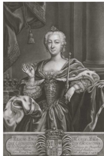
Maria Amalia di Sassonia (Dresda, 24 novembre 1724 – Madrid, 27 settembre 1760)