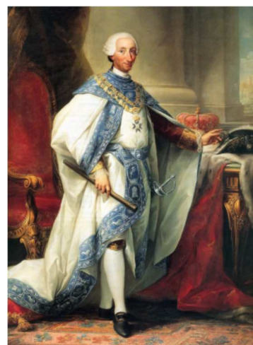
Carlo III. Carlo Sebastiano di Borbone(Madrid, 20 gennaio 1716 – Madrid, 14 dicembre 1788)