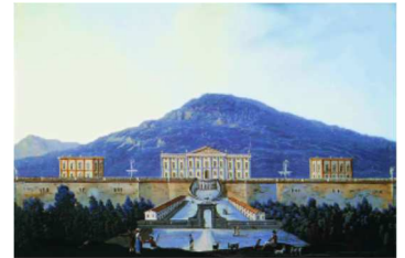
Il Palazzo Reale. Opera del secolo XVIII.