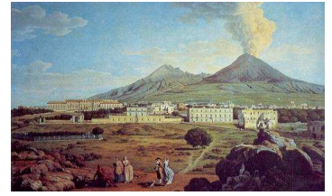
Il Palazzo Reale di Portici visto dal mare in un paesaggio di Giovanni Battista Lusieri del 1745.

Infra Urbem Hercnlis ... specula ad càptandos thinnos.