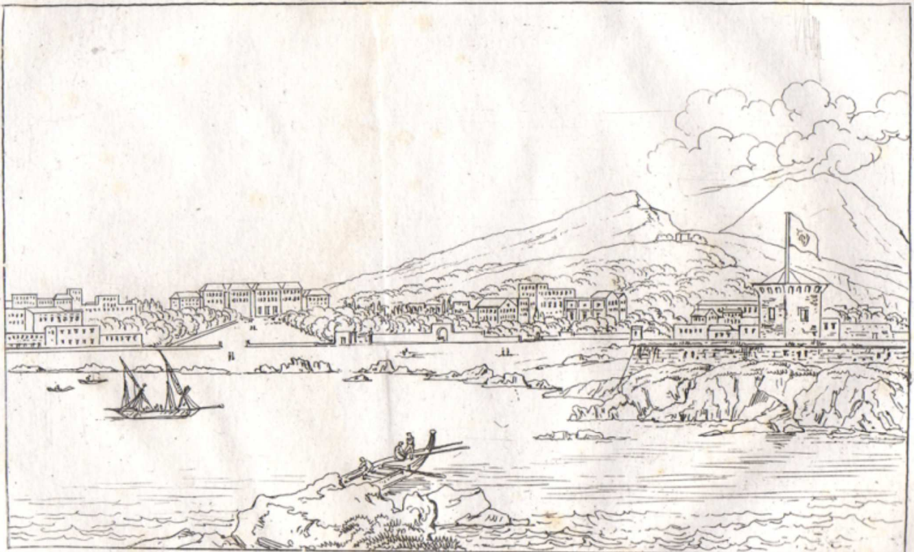
Real Palarmo di Portici Granatello

Il Granatello di Portici; veduta panoramica di Pinelli del 1823. Le antiche lave sulle quali venne costruito il Forte e ke