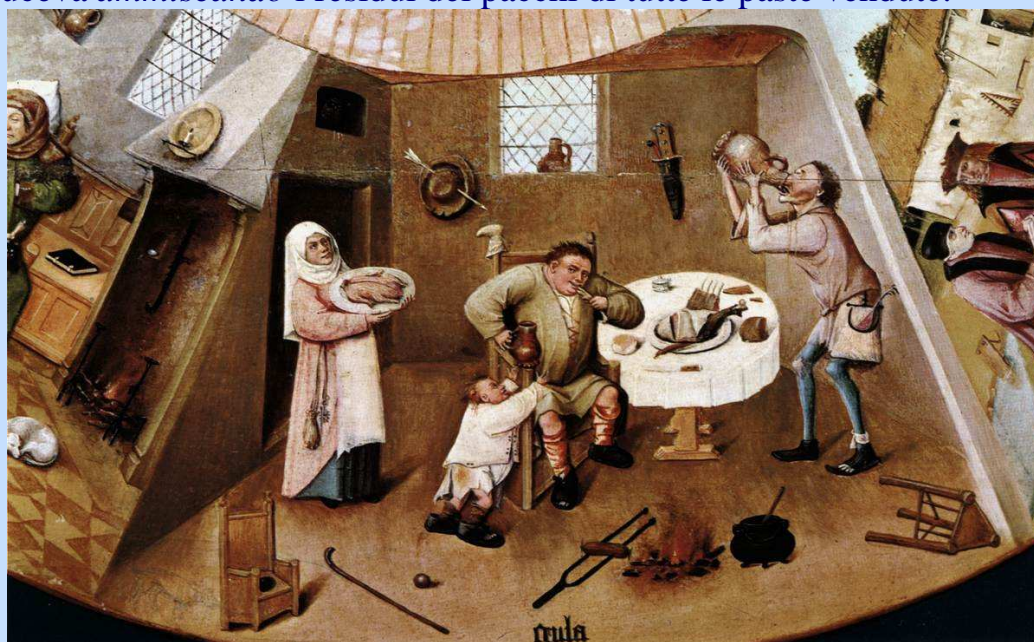
Hieronymus Bosch (1450-1516).

muzzunaglia: gastr. Minuzzaglia . L'insieme delle varie qualità di pasta, dei muzzuni residui anche della spezzatura della pasta longa , ottima come pasta mmiscata per pastefasuli . La muzzunaglia si produceva in casa, spezzando la pasta lunga che, specie i maccheroni, era schiacciata nella zona di appoggio sulle canne dov'era stata per l'asciugatura. Ma si comprava anche dal casarduoglio che la produceva ammiscando i residui dei pacchi di tutte le paste vendute.