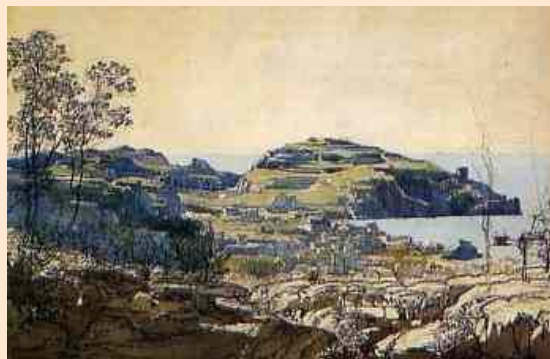
Iconografia: Giacinto Gigante (Napoli, 1806 – 1876)

Un'accurata bibliografia finale, l'indice dei nomi di personaggi del passato e recenti e un elenco delle canzoni del poeta sarnese testimoniano il rigoroso, attento e sentito lavoro condotto con competenza e professionalità.