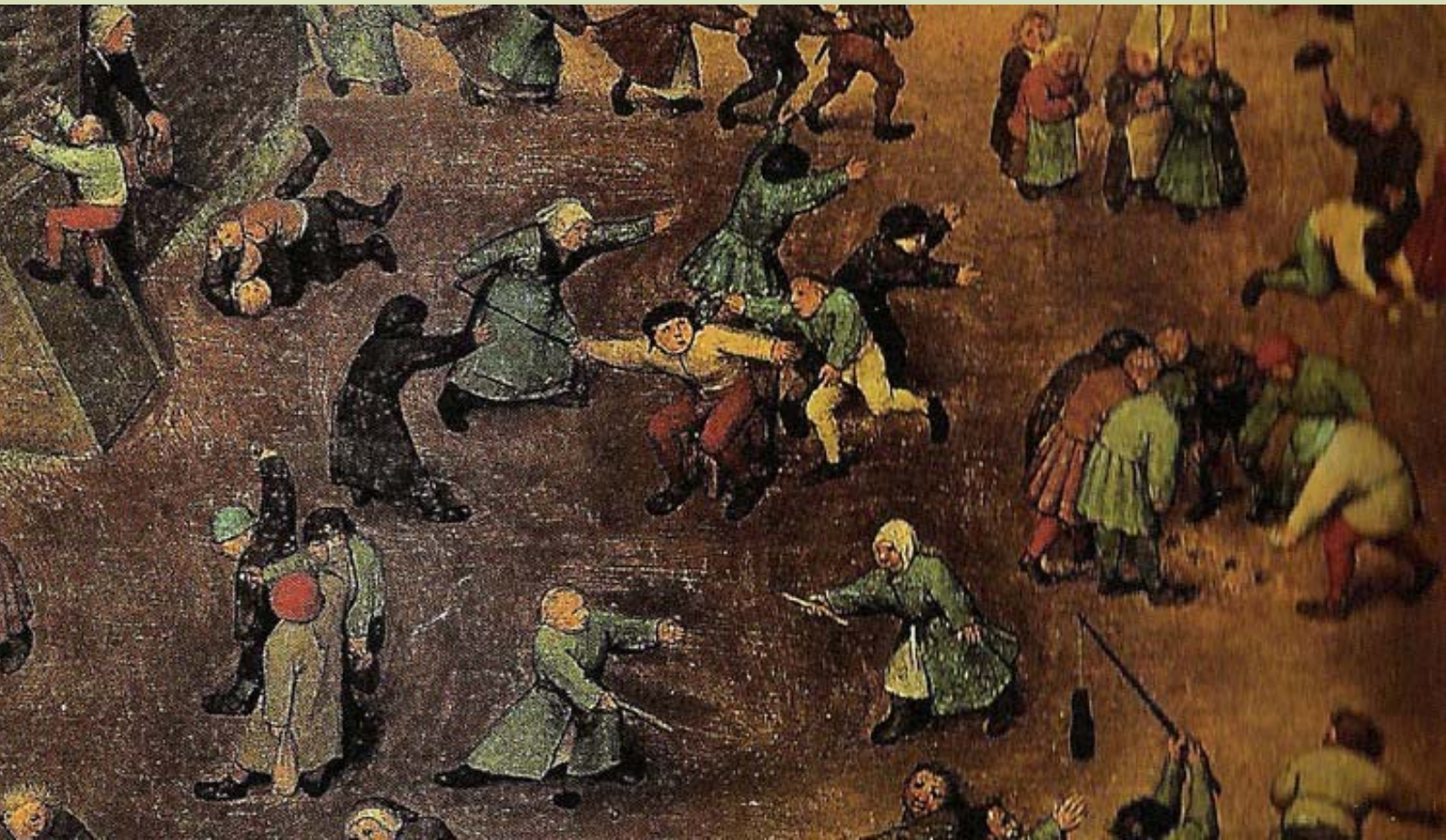
Pieter Bruegel il Vecchio (1525-1530 – 1569)