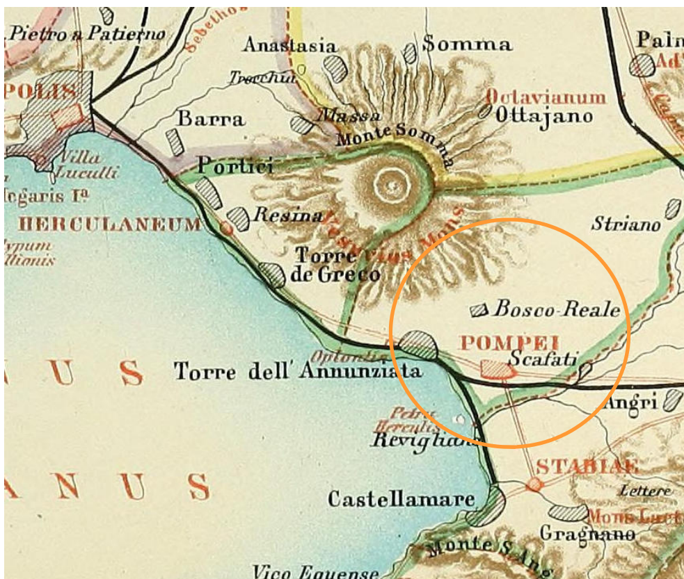
Carta del Vesuvio, da Belloch Campanien

Solo successivamente forse a causa delle continue eruzioni, di invasioni barbariche e di epidemie la zona venne abbandonata e sul fertile terreno eruttato dal Vesuvio crebbe una grande foresta che venne denominata nei documenti medioevali come Nemus Scifati , ossia Bosco di Scafati.