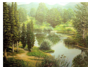
La campagna ad est del Vesuvio, in una ricostruzione dall'Antiquarium di Boscoreale.

Durante i primi anni del III-IV sec. d.C. nella zona vennero rinvenute tracce di un ripopolamento dell'area.