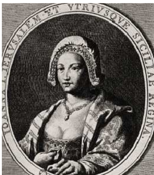
La Regina Giovanna I