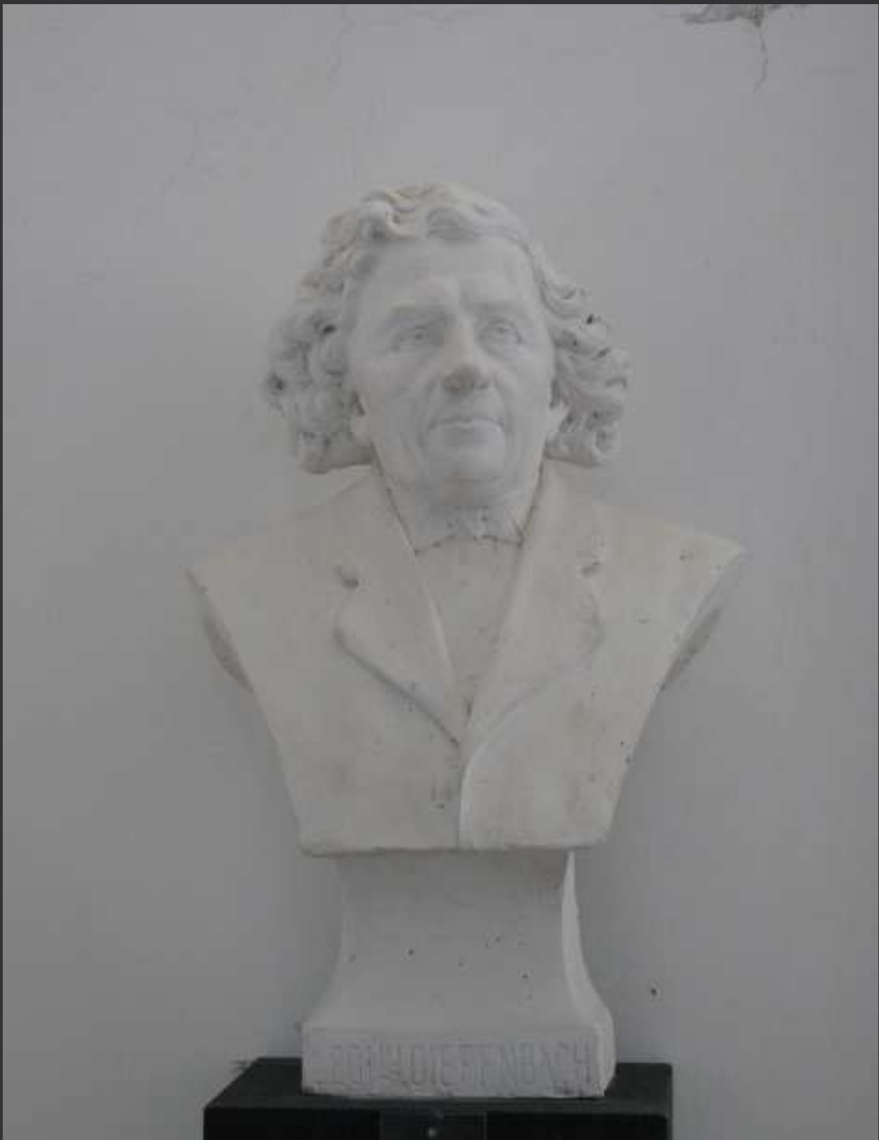
Diefenbach Karl Wilhelm (Hadamar 1851 – Capri 1913) Padre di Diefenbach Diefenbach's father Gesso modellato Model in plaster cm. 70