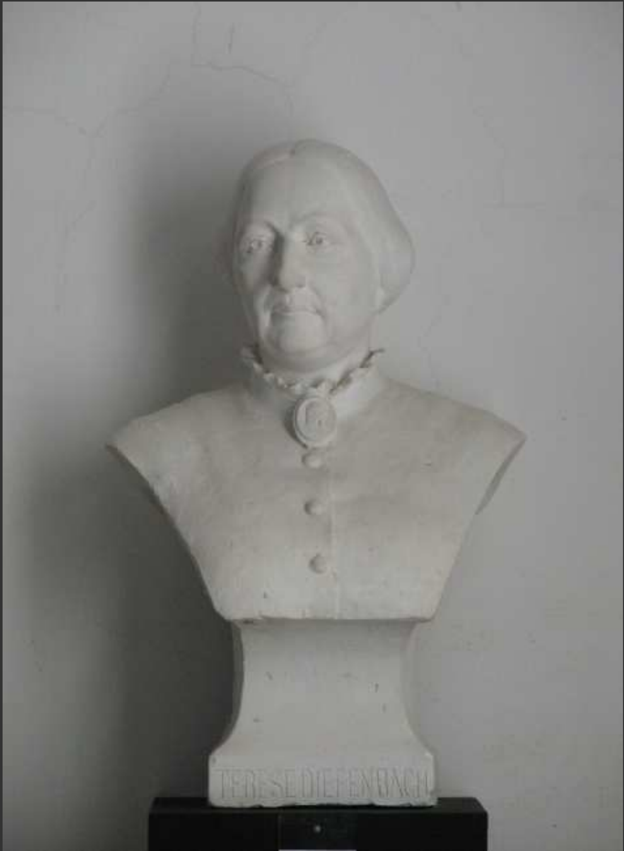
Diefenbach Karl Wilhelm (Hadar 1851 – Capri 1913) Madre di Diefenbach Diefenbach's mother Gesso modellato Model in plaster cm. 70