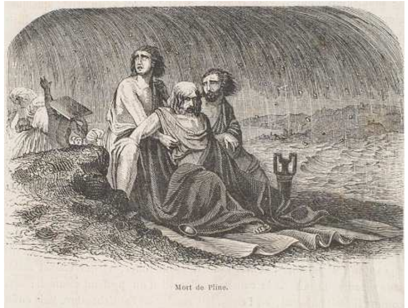
Immagine: Voyage Italie 1883.

Plinio ci racconta la storia dello zio morto sulla spiaggia di Stabia durante l'eruzione. Era sceso a terra per soccorrere l'amico Pomponiano e durante la notte volle scendere alla spiaggia dove fu soffocato dalle mortali esalazioni del Vesuvio.