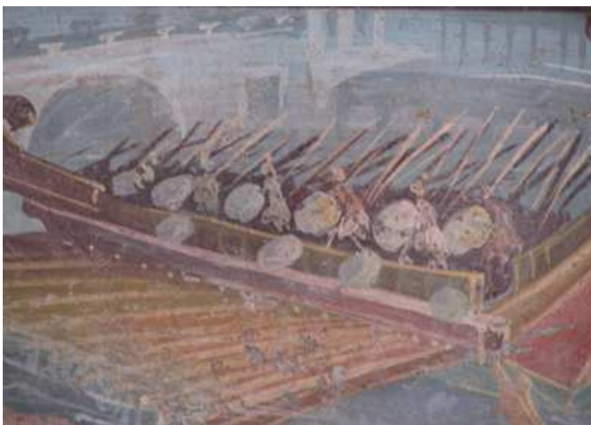
Immagine: dell'autore, 2010

Tra gli affreschi che decoravano il Tempio di Iside a Pompei vi sono alcuni "quadretti" che mostrano le navi da guerra romane. Le vediamo con i remi in alto, in segno di pace. Stazionano nei pressi di un porto. Non ne siamo certi, ma quello sullo sfondo potrebbe proprio essere Miseno o Baia.