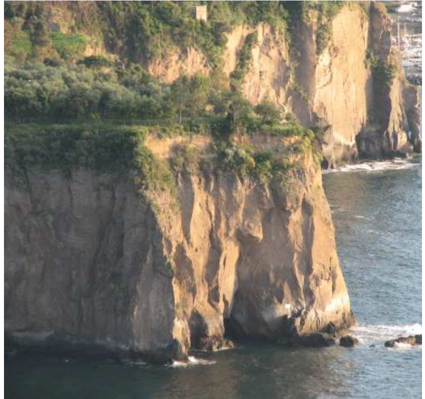
primavera 2008

E' visibile lungo quella costa, il grandioso banco simil tufaceo, che generò la piattaforma vesuviana. Lo si incontra, appena lasciata Castellammare di Stabia, mentre la statale va ad incontrare il primo paese: Meta di Sorrento. Uno spettacolo della geologia vesuviana e campana che ha pochi eguali in giro. Uno spaccato terrificante di quelli che erano i primitivi sconvolgimenti geologici.