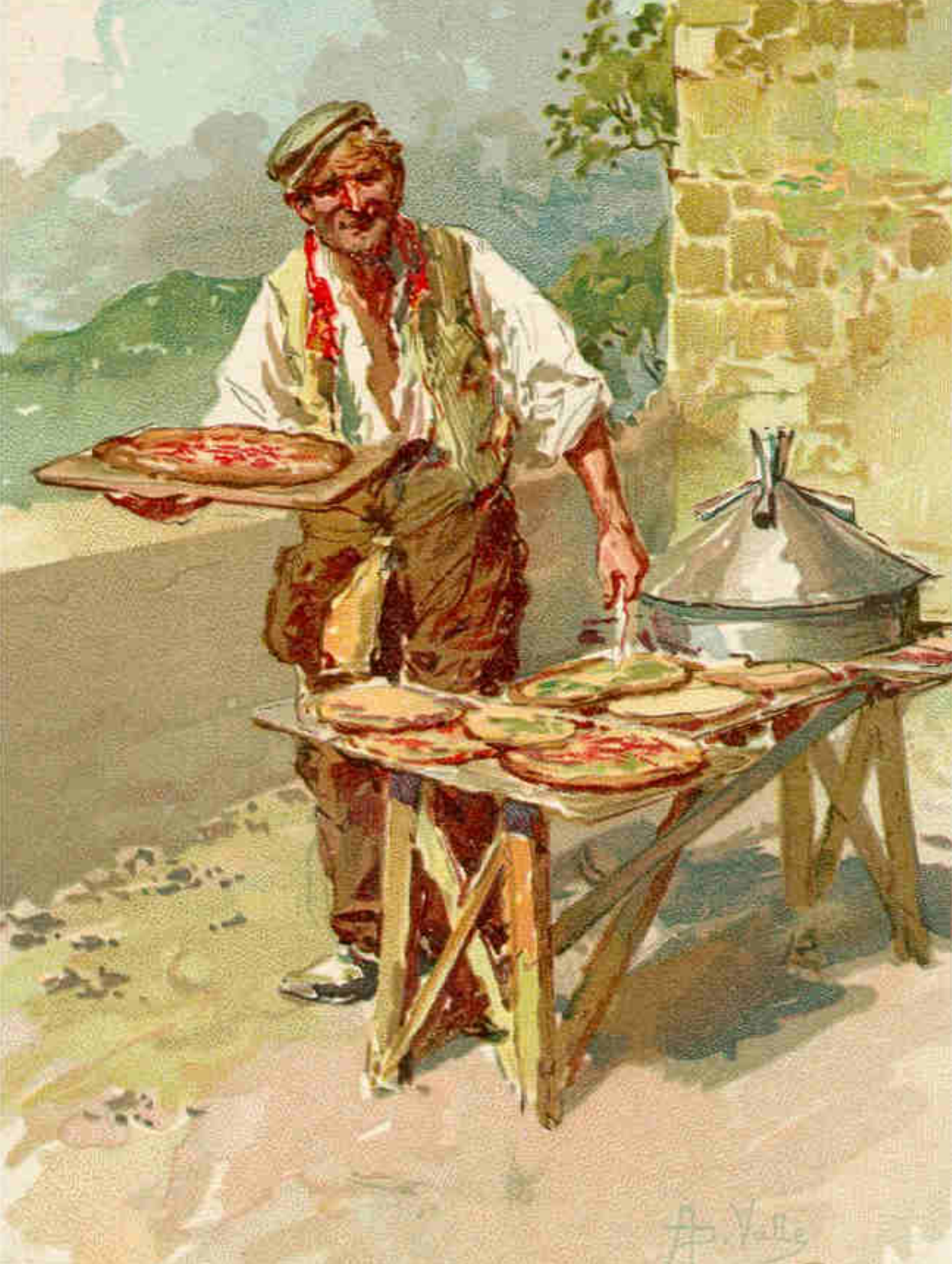
LO PIZZAIUOLO (Venditore di focaccia)