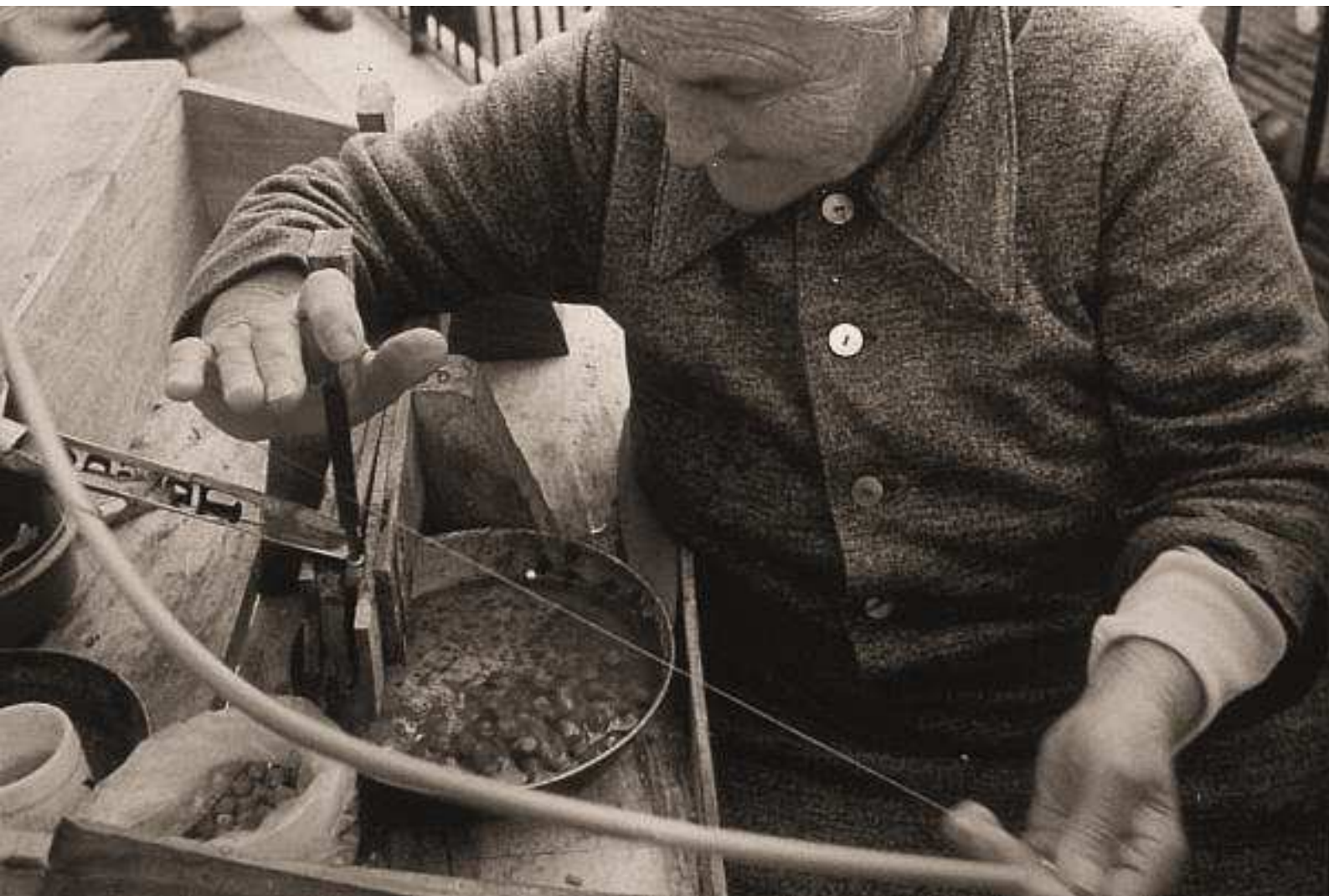
La Bucatrice del corallo