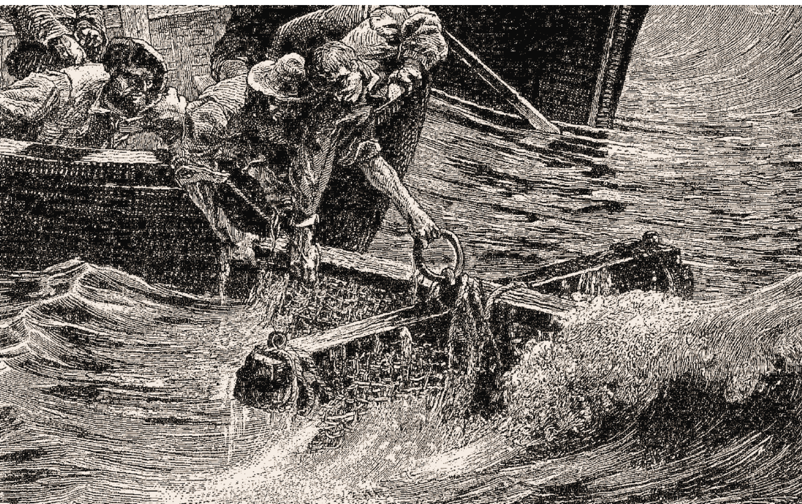
Immagine della pagina precedente e dettaglio tratti da “Bibliothèque des écoles et des familles” di J. Gourdault dal titolo “Naples et la Sicilie” Edito a Parigi bel 1898