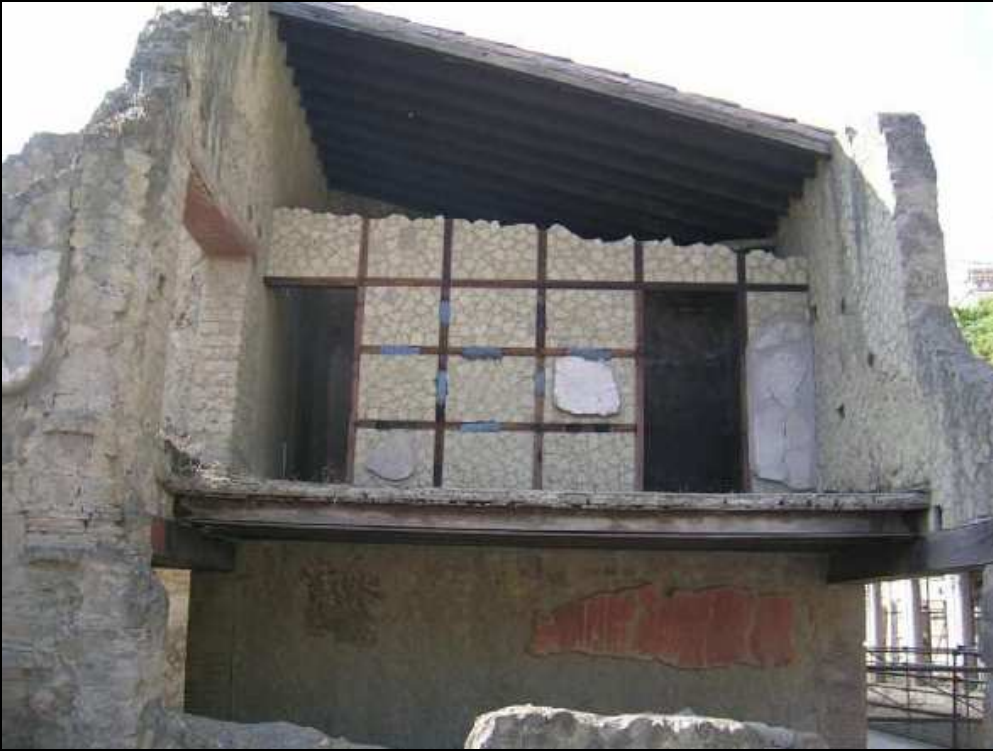
In alto la bottega ad angolo tra cardo V e Foro.