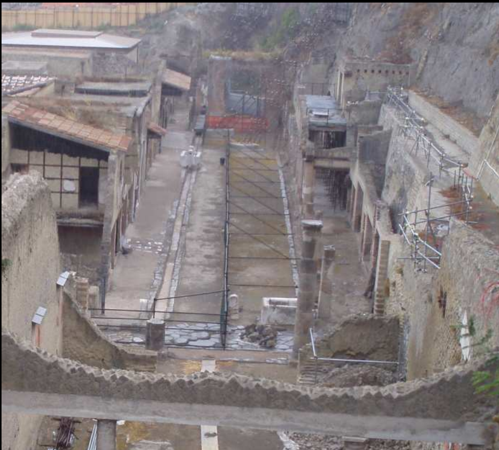
A sinistra vista d'insieme sul Foro di Ercolano.