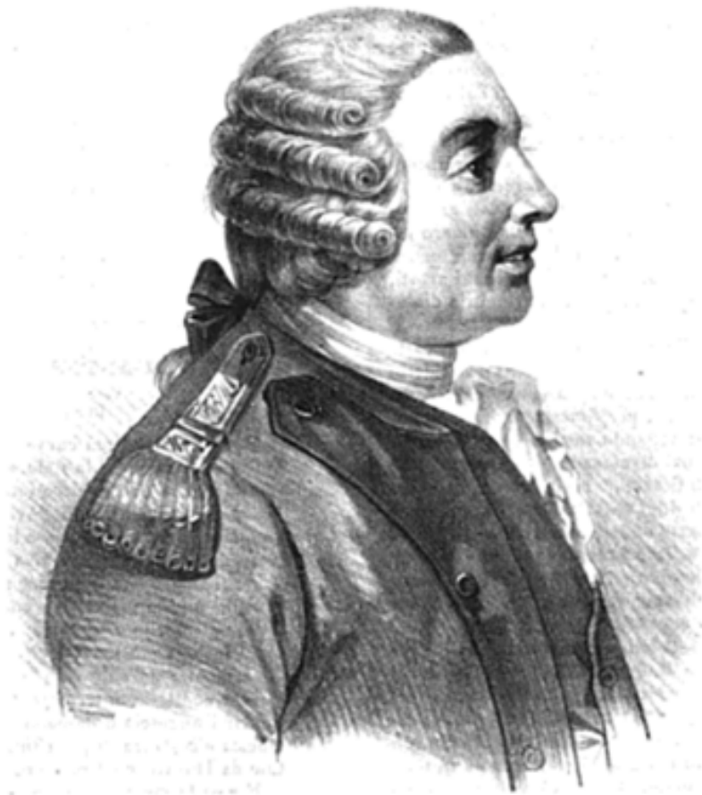
( Giovanni Carafa Duca di Noja. )