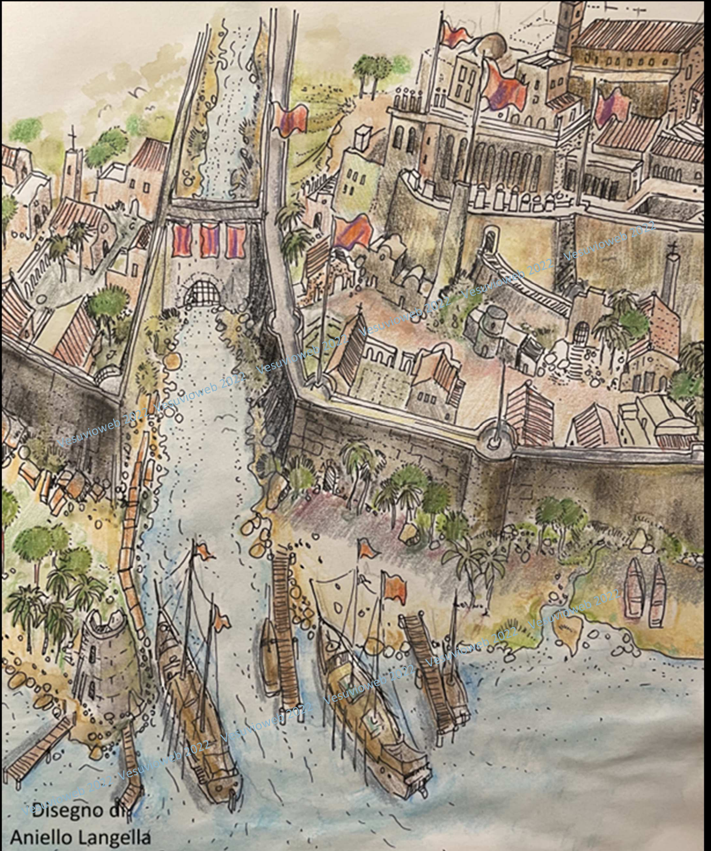
Disegno di Aniello Langella