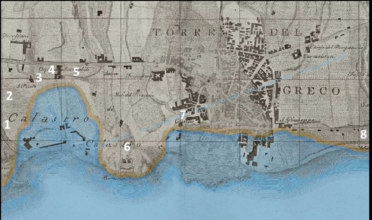
Topografia dei fratelli Pietro e Francesco La Vega. Dettaglio cartografico del 1795