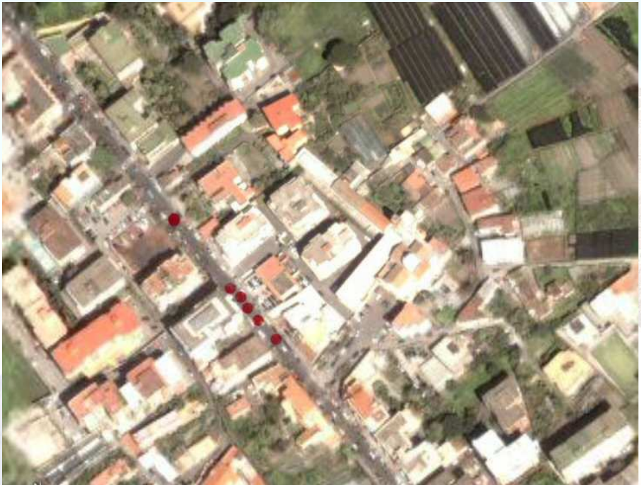
Elaborazione grafica A. Langella

Grazie alla segnalazione di un tecnico dell'Acquedotto Vesuviano (sede di Ercolano) sullo scordo del 2002 è stata ispezionata a Torre del Greco una