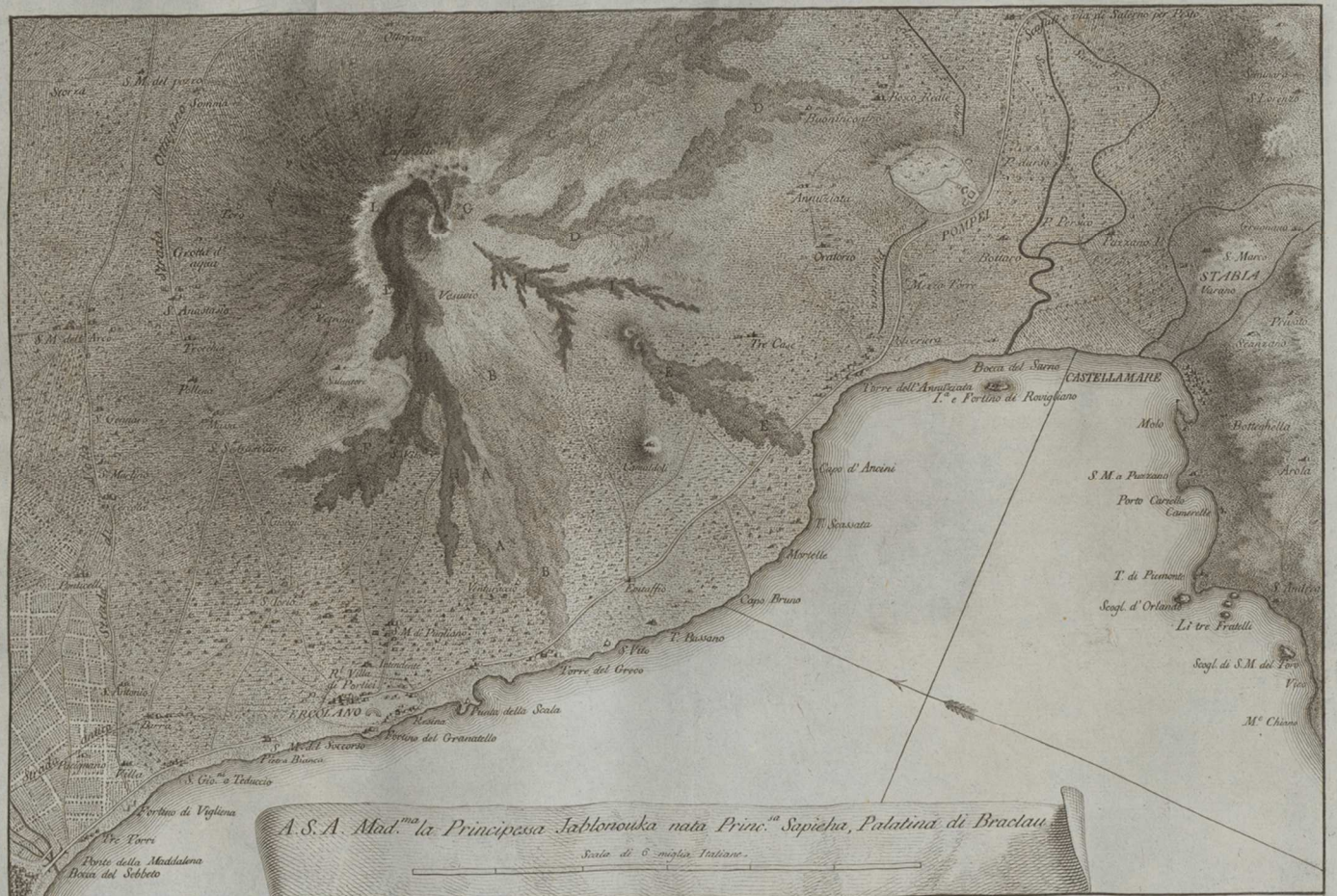
Edip. Macchi. f. Piano del Volcano di Napoli, denominato il Vesuvio; colle veggute rimarchevoli eruzioni seguite in più Tempi. A. eruzione seguita nell'anno 1723. B. eruz. nell'anno 37. C. eruz. nell'anno 51. D. eruz. nell'anno 54. E. eruz. nell'anno 60. F. eruz. nell'anno 67. G. eruz. nell'anno 70. nel sito detto atrio del cavallo. H. eruz. nell'anno 71. L. eruz. in fine del anno 76. I. eruz. spaventevole degl'8 Agosto 79.