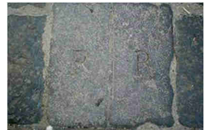
Il confine tra i comuni di Ercolano e Portici.

Il primo punto della contesa territoriale fu quindi legato al "furto" che i resinari, eredi della romanità ercolanese, vedevano ogni giorno consumarsi sotto i propri occhi. Ma un altro boccone amaro dovevano ingoiare i resinari i quali, se da un lato mal tolleravano quei soprusi compiuti sulle proprie memorie storiche, dall'altro dovettero soccombere ad un decreto della Regia Camera della Sommaria del 25 giugno del 1740, che di fatto privava il municipio di Resina del territorio delle Mortelle che dal Palazzo Reale andava fino al Forte del Granatello.