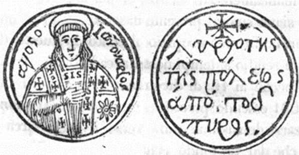
Aureo del periodo ducale che riporta l'effigie di San Gennaro sul fronte. Due versioni identiche dello stesso pezzo in due testi della bibliografia, tra cui il Tutini.

Le monete coniate in occasione di quell'evento che lega la storia del ducato al Vesuvio ed al nostro Santo protettore, ci sono pervenute attraverso le immagini dei testi ed esprimono la riconoscenza del popolo che volle ringraziare Gennaro.