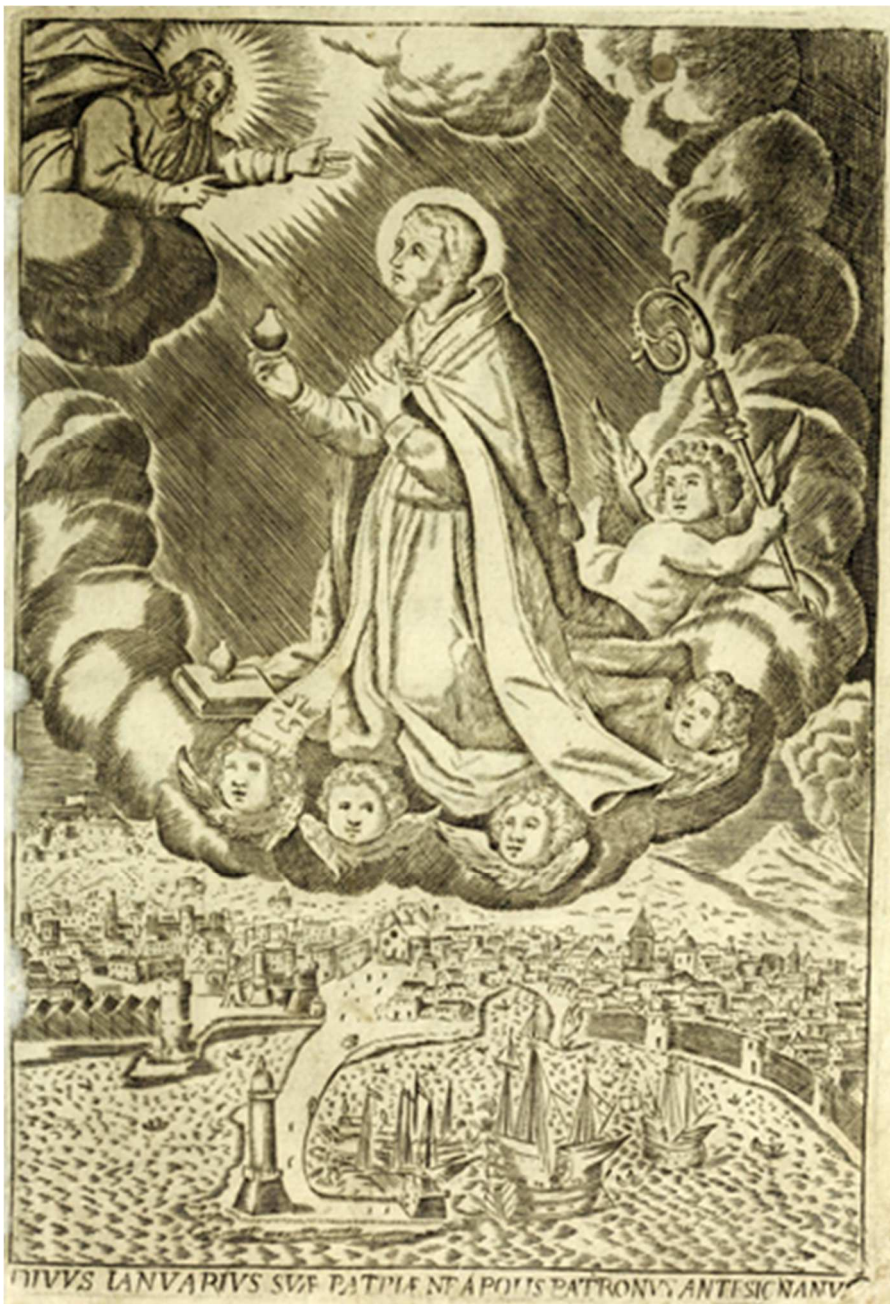
San Gennaro in gloria davanti al Padreterno nella gloria degli angeli, offre il suo sangue e attende il pastorale simbolo del potere vescovile sulla città di Napoli.

La città di Napoli è di San Gennaro e lui è per la città. Vivono come due anime dello stesso corpo, l'una accanto all'altra senza darsi disturbo e condividendo ogni cosa. Dalla felicità ai dolori. Il Santo accoglie sempre le richieste dei suoi concittadini, che da sempre lo hanno ospitato nella sua casa al Duomo. Sì, è vero, la storia ci ha anche parlato di un paio di trasferte in altre città, ... ma per Gennaro, Napoli era sempre casa sua. 1