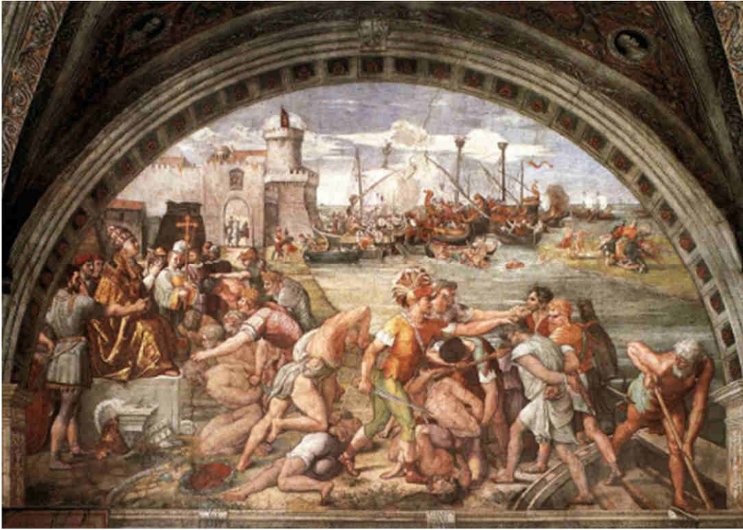
L'affresco di Raffaello Sanzio, intitolato "Battaglia di Ostia", indicativo della leggendaria fama della battaglia

cittadini. Il papa utilizzò la vittoria facendo lavorare alle fortificazioni di Roma quelle stesse mani ch' erano venute per disfarle”.