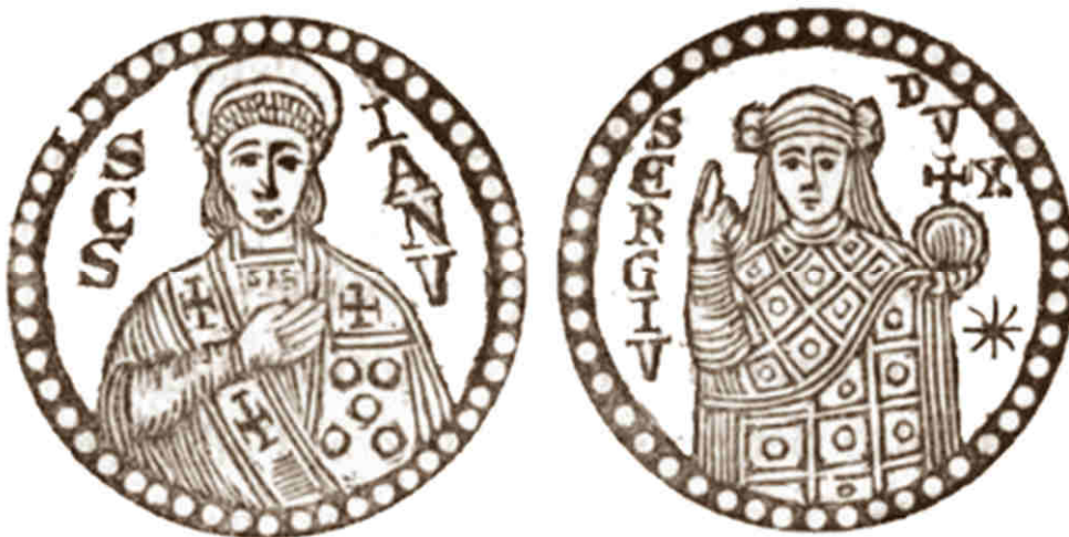
San Gennaro benedicente S(AN)C(TU)S IANU(ARIUS) - SERGIU(S) DUX

La prima moneta, si ritiene sia stata conosciuta intorno all'847. La prima mossa di strategia politica. Una sorta di riconciliazione del Dux con il popolo. Non conosco il valore reale di questo conio e forse non c'è dato sapere. Possiamo anche ipotizzare che sia stato un conio limitato a pochi; forse indirizzato ad ambienti ristretti della corte e della stessa Chiesa napoletana. E se la mia congettura è realistica, devo anche dedurre che il messaggio di questa moneta al popolo non giunse mai.