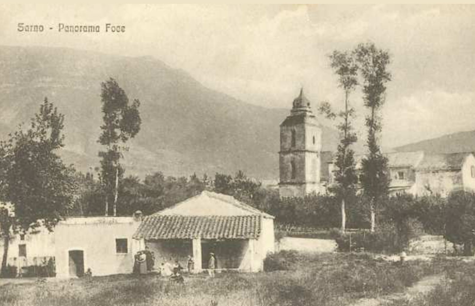
Sarno - Panorama Foce