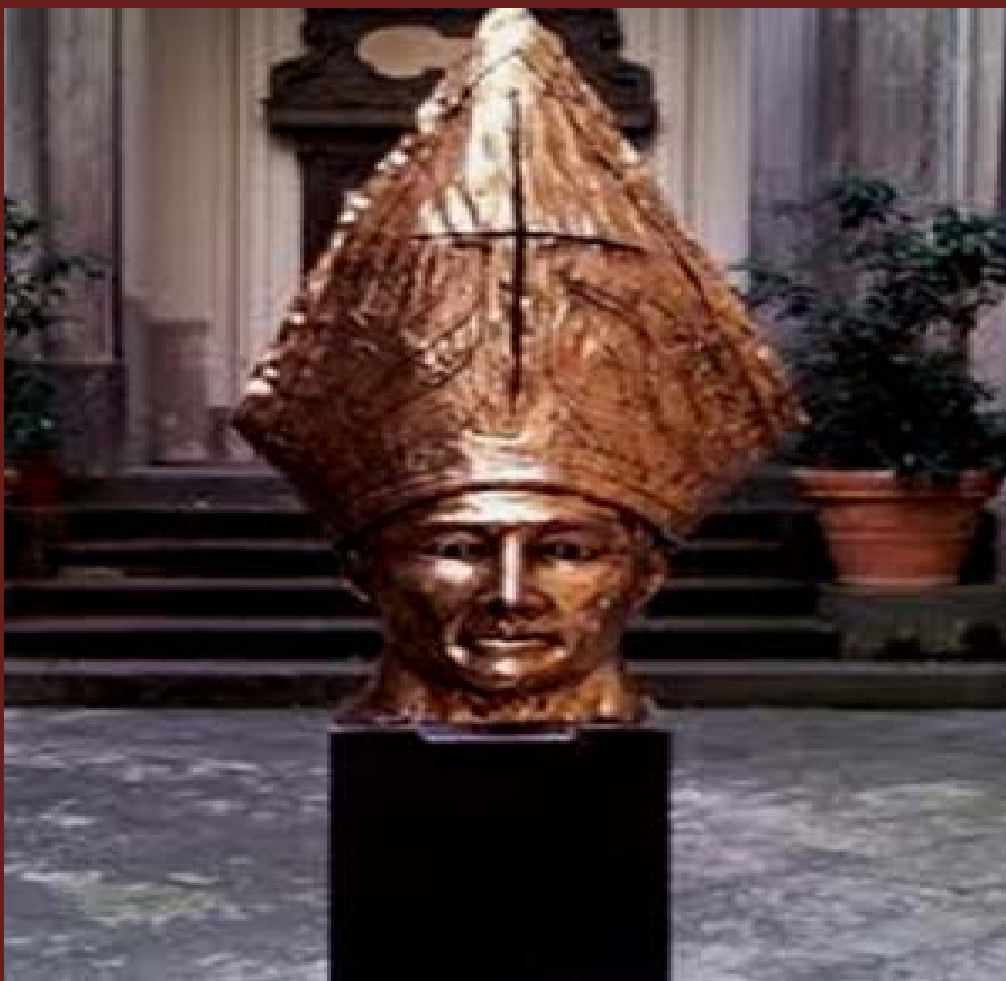
Busto in bronzo dorato, San Gennaro 2011. Museo del Tesoro.