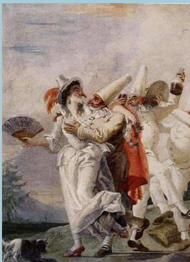
Pulcinella innamorato (Tiepolo)

Questo in sintesi il ritratto storico, caratteriale ed onomastico della nostra maschera, la cui figura teatrale –ribadiamo– incarna quella del bietolone-vittima talvolta rischiarato da impennate di lucidità che fruttano improvvise ribellioni contro ingiustizie e soprusi, ma anche lampi di furbizia ora positiva, ora socialmente negativa: un po' come nell'anima del popolo napoletano, che egualmente alterna ingenue credulità beffeggiate e sopraffatte a fiammate di giuste e insofferenti rivolte di riscatto, nonché momenti di scaltrezza mal prevaricante, sempre cantando e affrontando la vita dietro il paravento d'una filosofia elementare, puntualmente all'insegna dell'oraziano “ carpe diem! ”.