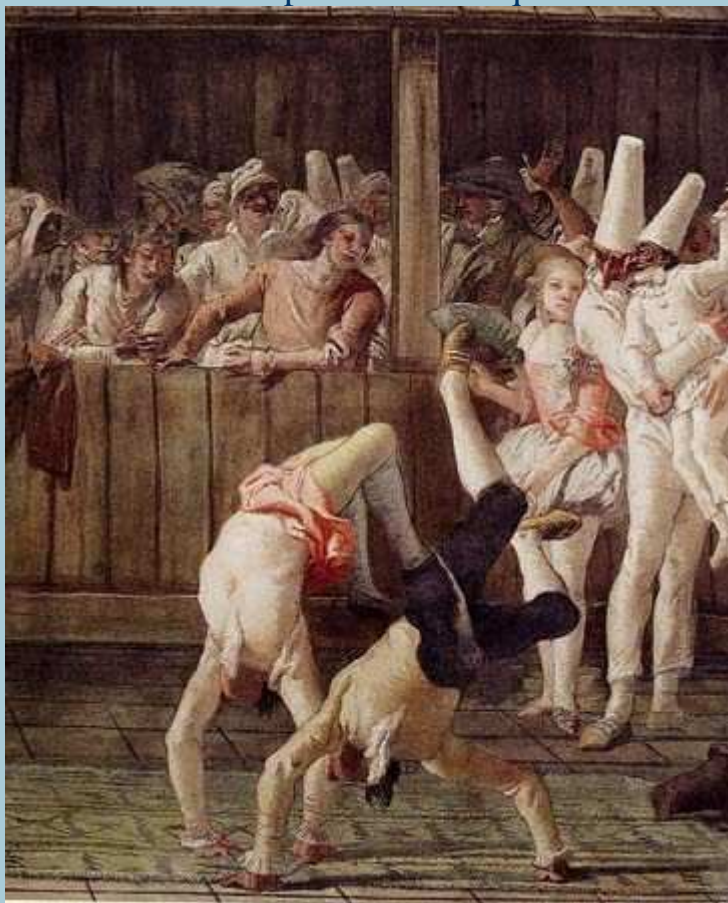
Pulcinella e i saltimbanchi (Tiepolo)

Ci sono poi sviluppi espressivi ben noti, collegati al suo nome: dalla frase “ essere nu pulecenella opp. fa’ ’o pulecenella ” con passaggio dal nome proprio a quello comune, con articolo maschile avanti a lemma conservativo della sua originaria forma femminile ormai stereotipata e con allusione alla spiritosaggine che talvolta degrada al limite estremo della “pagliacciata”, fino a “ ’o segreto ’e Pulecenella ”, per indicare un segreto non piú tale, perché ormai venuto a conoscenza di tutti; cosí risultò offensivo od allusivo il nomignolo di “ Re Pulcinella ” attribuito dagli avversari a Ferdinando I, il nasuto sovrano delle Due Sicilie, al governo dalla fine del Millesettecento al primo venticinquennio dell’Ottocento.