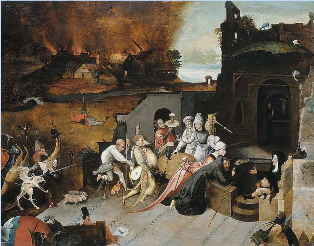
Immagini: Hieronymus Bosch, (1450-1516).

Chiude il volume una bibliografia, che nella sua essenzialità, appare molto puntuale sia per i testi che per gli Autori citati.