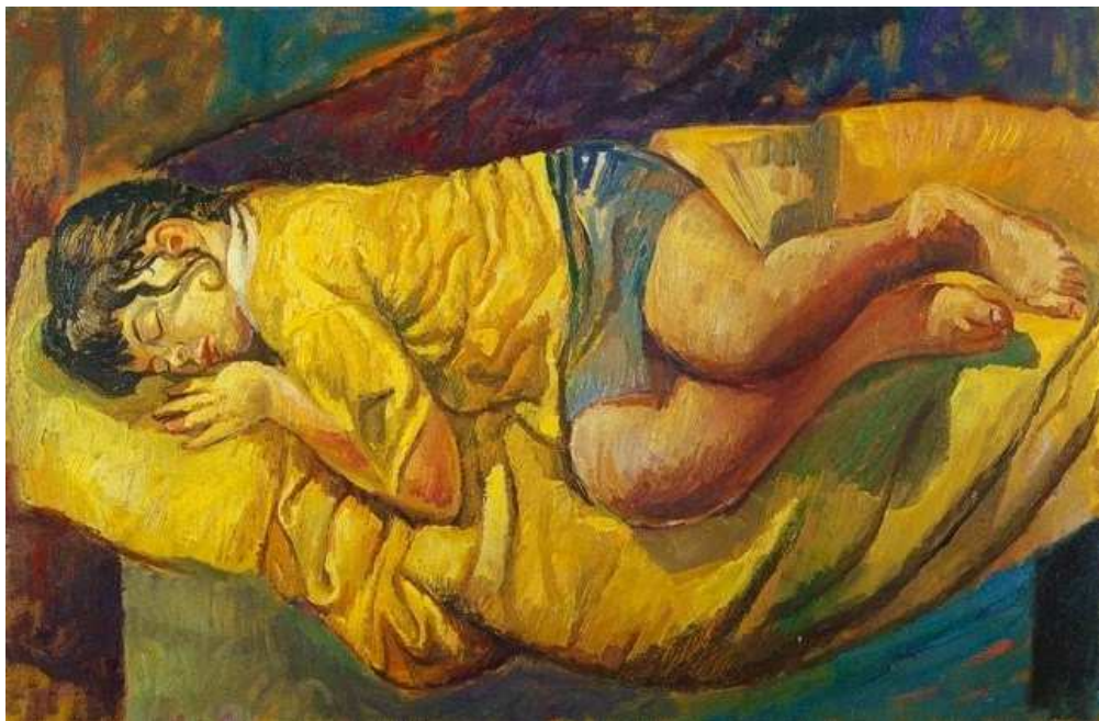
Illustrano il testo le tele del maestro Tindaro Calia

Oggi mi torna alla mente una storia e voglio narrarvela.