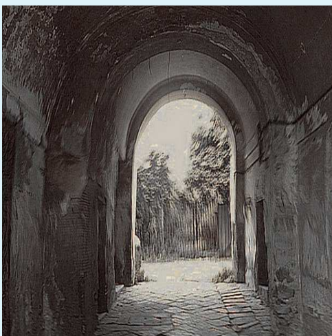
Interno del cortile del palazzo con giardino. Locale terraneo attaccato al palazzo sul versante sinistro