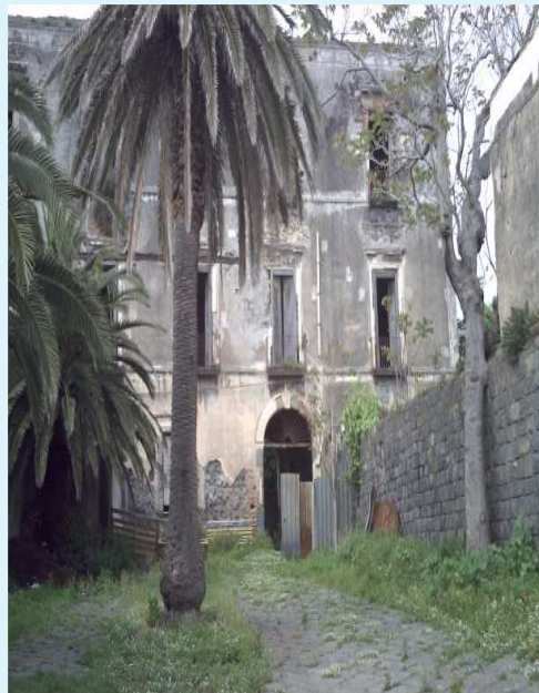
Palazzo Fiorillo poi Sambiasi Esterno