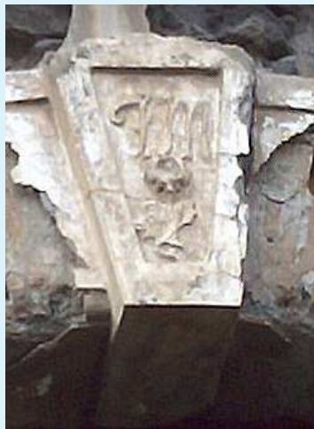
Stemma dei Fiorillo