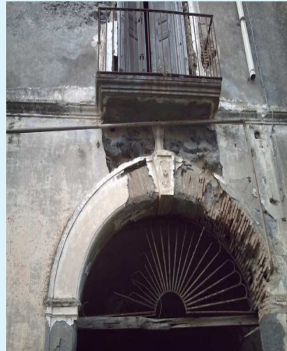
Particolare del portale con stemma