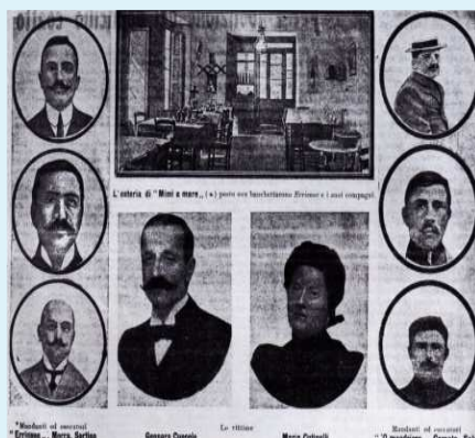
I coinvolti nella vicenda Cuocolo