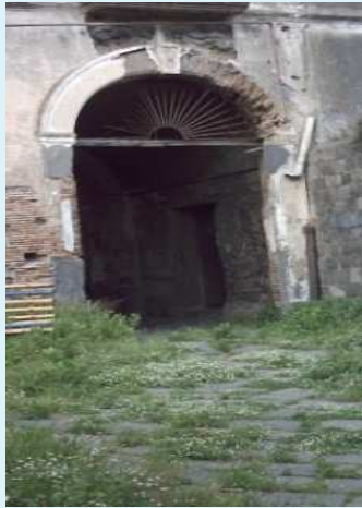
Portale del palazzo Fiorillo