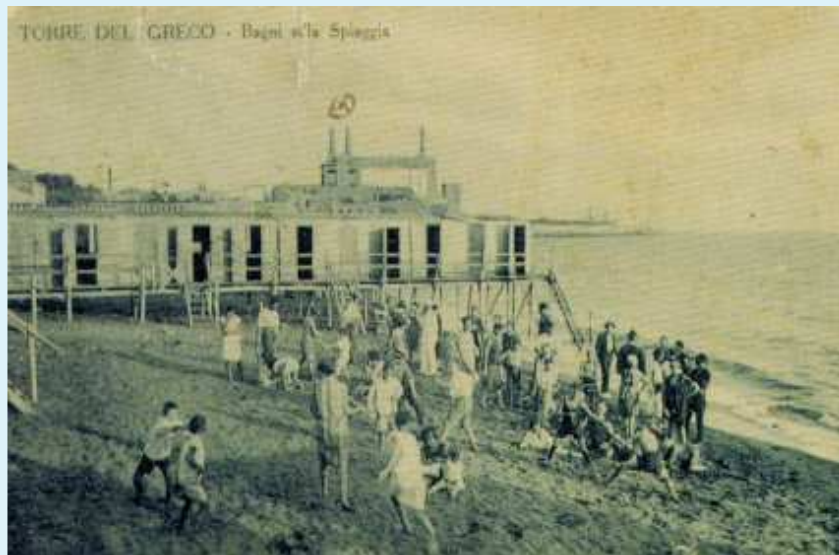
Altra veduta della scala a Torre del Greco con persone sulla spiaggia