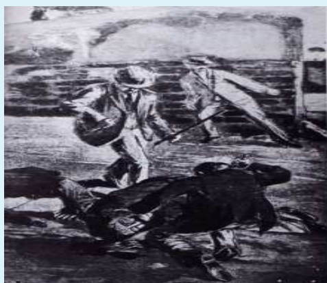
L'assassinio di Cuocolo.