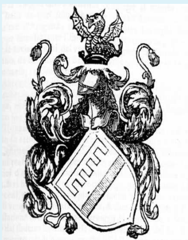
Stemma dei Sambiasi