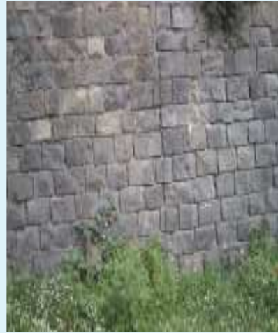
Particolare del muro di quadroni in pietra lavica attaccato alla chiesa