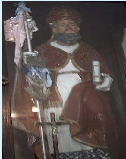
Interno della chiesa: altare con quadro Interno della chiesa: statua di S. Biagio della titolare