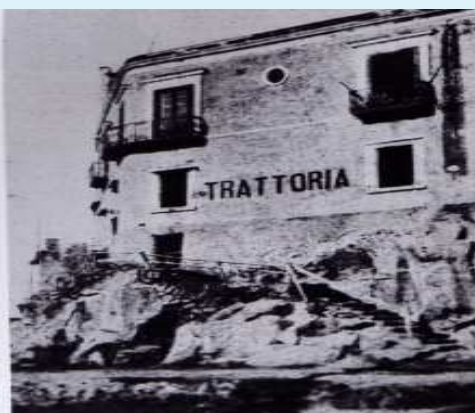
La Trattoria "Mimì a mare"