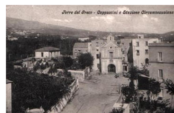
La chiesa della SS. Annunziata annessa al convento dei PP. Cappuccini di Torre del Greco.

Nell'eruzione del 1631 patì il convento danni parziali, così pure in quella del 1794, in cui la lava colmò il burrone che circondava dal lato inferiore il poggio su cui l'edificio sorgeva. Vi menarono i frati vita beata fino all'anno 1867 in cui soppresso la loro comunione, l'edificio passò al Demanio dello Stato, dal quale fu dato in uso al Municipio di Torre del Greco.