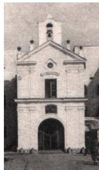
La chiesa della SS. Annunziata annessa al convento dei PP. Cappuccini di Torre del Greco.