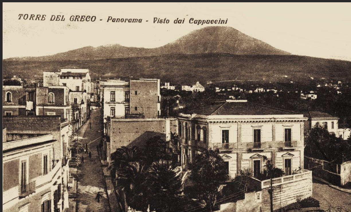
La zona dei Cappuccini di Torre del Greco.