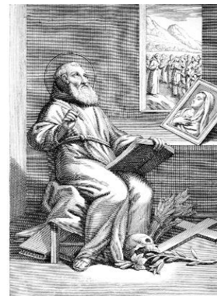
S.P. LAURENTIUS A BRUNDISIO FF. CAPUCCINORUM VIC GENERALIS

Fu durante quest'ultimo viaggio che lo colse la morte avvenuta nei pressi di Lisbona il 22 Luglio 1619. Dichiarato Santo nel 1881 e da Papa Giovanni XXIII dichiarato dottore della Chiesa per la sua profonda spiritualità congiunta ad una profonda cultura filosofica e teologica come appare dai suoi scritti.