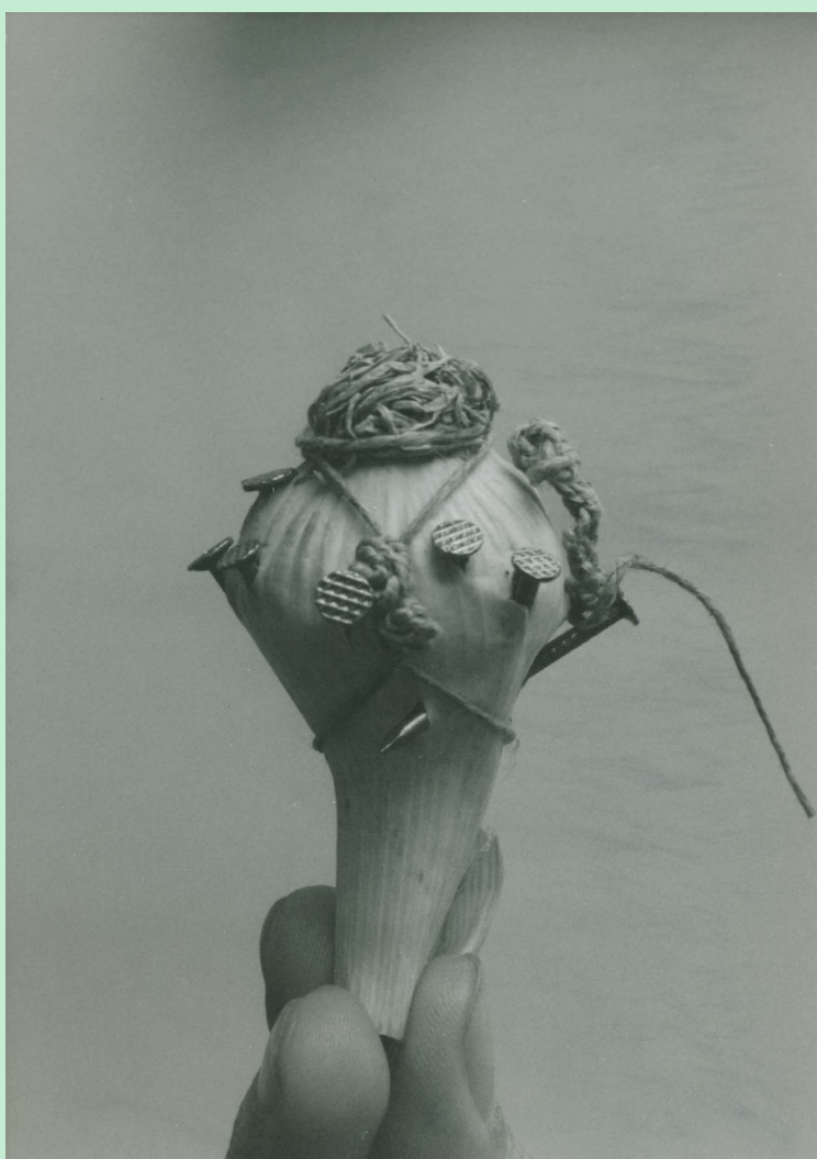
18L'AGLIO D' 'A SPARTENZA