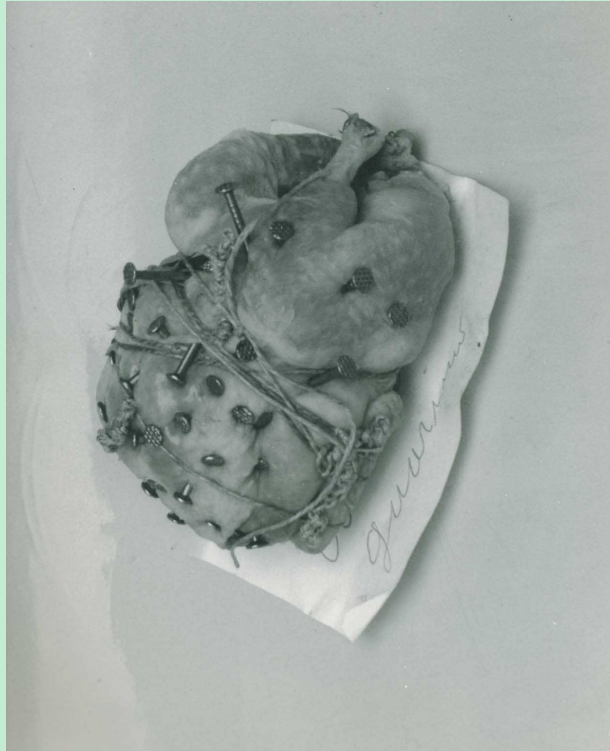
17Viene effettuata su una quaglia legata con uno spago appositamente preparato. Durante il rito l'operatore conficca un certo numero di chiodi che varia a seconda delle circostanze. Nell'agro nolano è utilizzata per favorire il ritorno dell'amato dopo una rottura. L'elemento deve essere interrato il più vicino possibile alla vittima insieme ad un biglietto con le sue generalità. (zi Filumena di Cimitile)

Il fenomeno magico è fortemente presente nell'agro nolano. Da una ricerca effettuata in questa zona è emerso un quadro piuttosto chiaro del tipo di mago che opera in questo contesto e dell'ambiente socio-economico di provenienza del cliente. I maghi operano al riparo dei media, il potere magico è acquisito per tradizione o per rivelazione e ciò avviene in sogno o in uno stato estatico. In entrambi i casi il potere di ogni mago si manifesta tramite la rivelazione di presenze occulte che vengono denominate “esseri” .