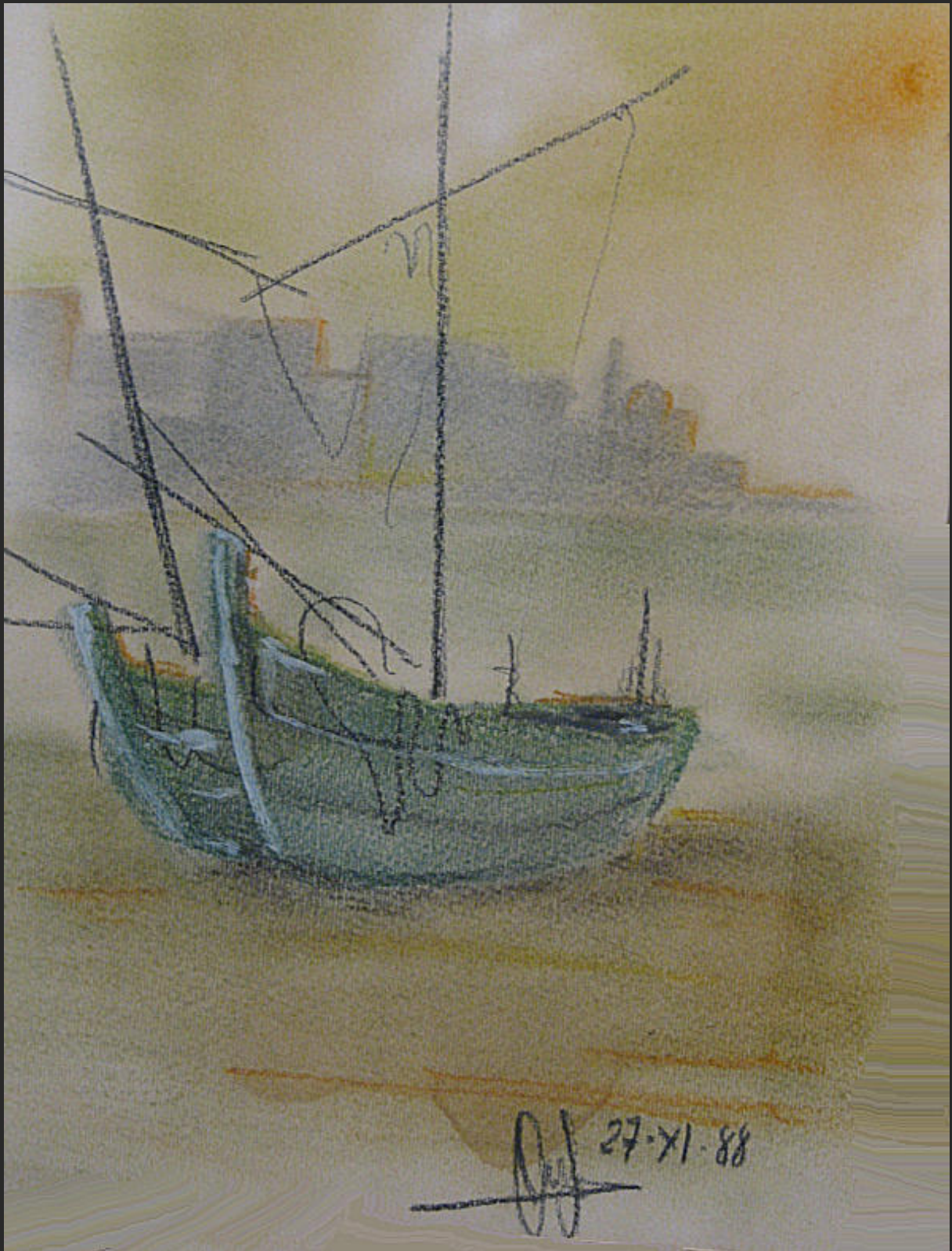
Illustrazioni di Aniello Langella