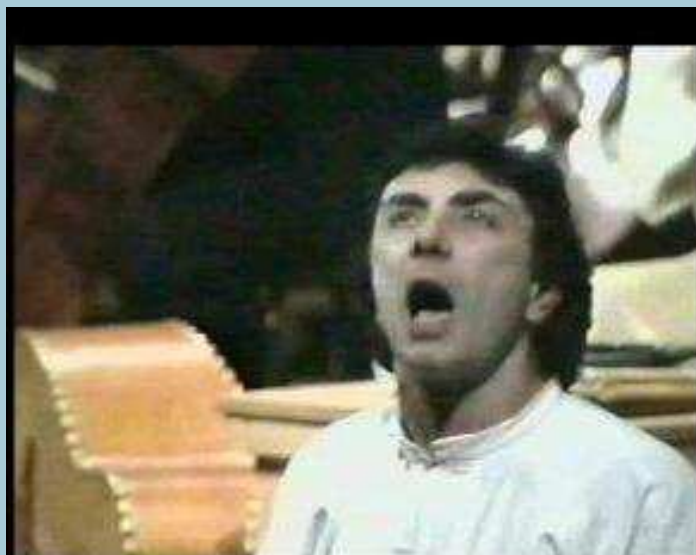
La Cantata di Masaniello.