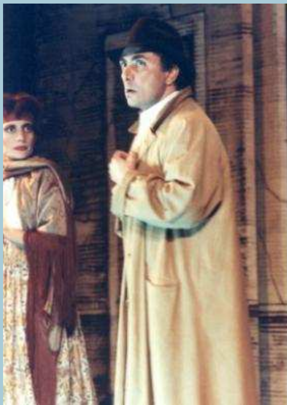
900 – Napoletano