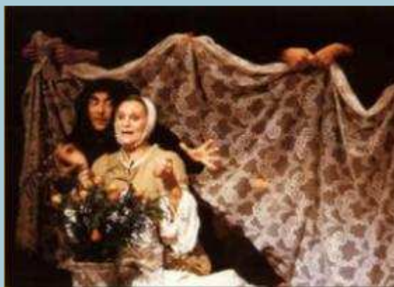
La Gatta Cenerentola: U munaciéllo.