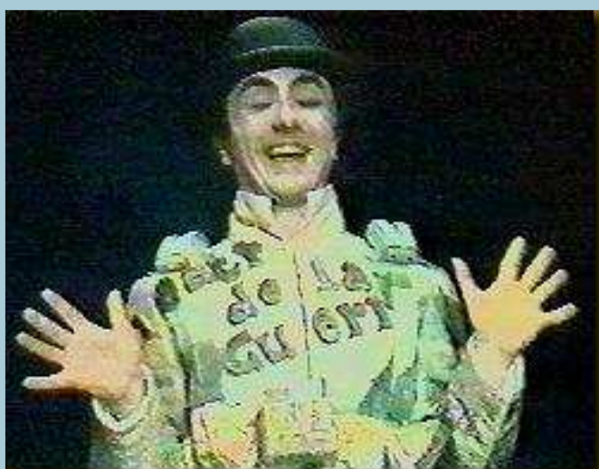
Strawinskij: Histoire du Soldat