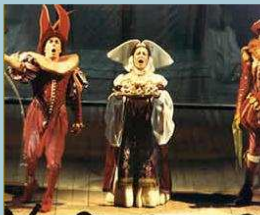
La Gatta Cenerentola