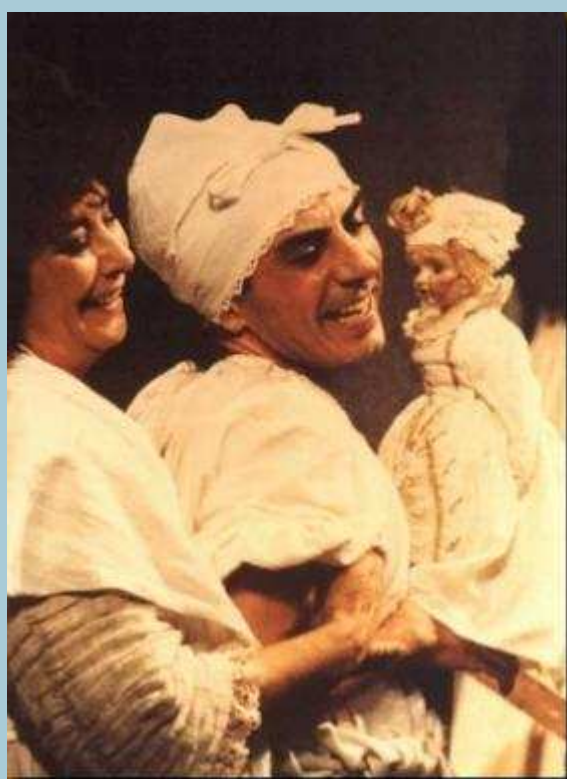
La Gatta Cenerentola: U femminiéllo.