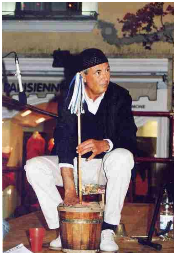
Crocò. Da La meza de seje.

Cianna fece venire quattro figliole ch’aveva, una de le quale se chiammava Cecca, l’auta Tolla, la terza Popa e la quarta Ciulletella. Le primme doie avevano duie tammorrielle, l’auta le castagnelle e la quarta cantava. E, accossí de mano ‘n mano mutanno scena, cantava l’auta e l’aute sonavano.