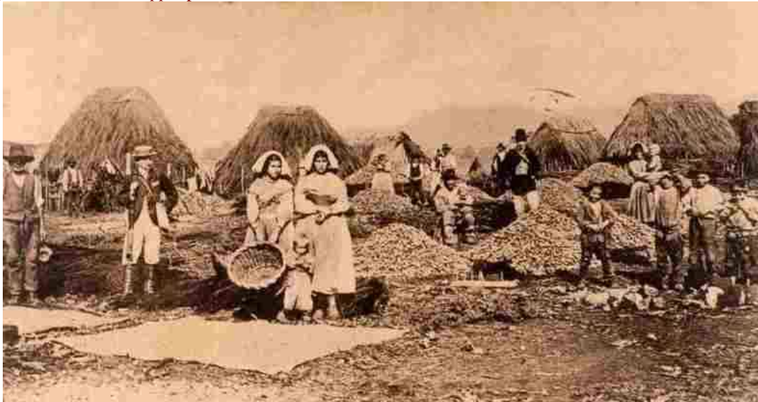
a mmòvere lu ggráno

Per un confronto con il dialetto torrese riporto la versione napoletana del testo secondo Roberto De Simone per la NCCP.