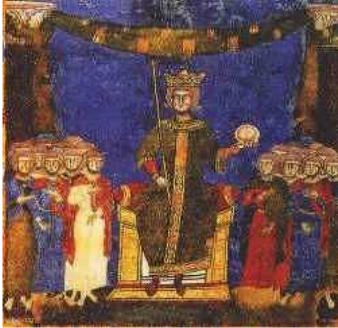
La Corte di Federico