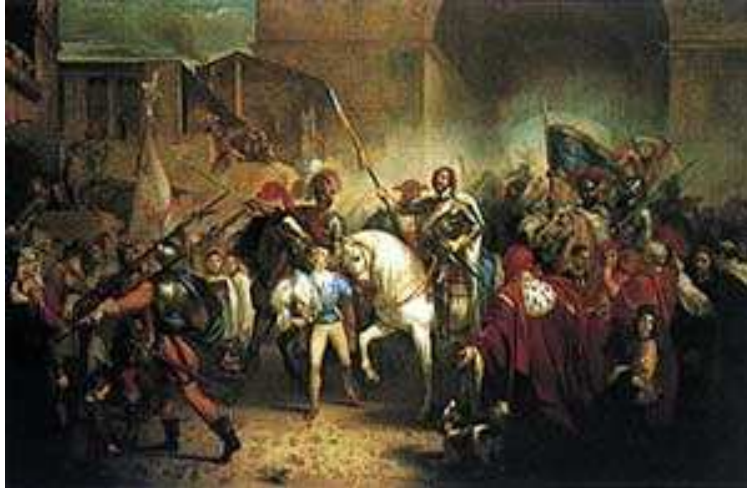
Ingresso di Carlo VIII a Firenze.

A la rota, a la rota, mast'Angelo nce joca: nce joca la zita e marama Margarita.