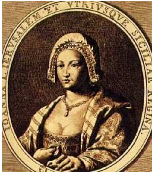
La Regina Giovanna I