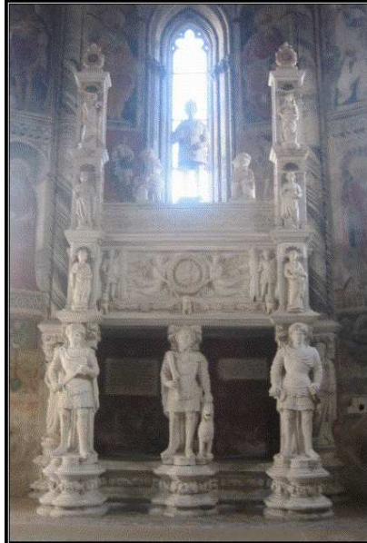
Mausoleo di Sergianni