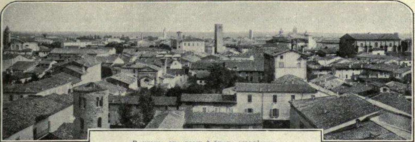
« RAVENNA STA COME È STATA MOLT'ANNI ».