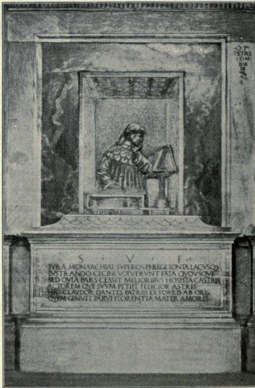
IL MAGGIOR OSPITE DI RAVENNA (Bassorilievo del Lombardi).

e dopo ed anche oggi, al suo ospite maggiore: l'Alighieri. Ebbene, tra i documenti venuti in luce ordinando l'archivio ricordato, esiste una ducale di Cristoforo Moro data da Venezia il 3 ottobre 1464 con la quale si ordina a Giovanni Mocenigo podestà e capitano di Ravenna di ospitare con degne onoranze la magnifica dama Lucrezia d'Alagno nobile napoletana « et olim vivente serenissimo Rege Alfonso memorabilis extimationis ». Chi fu costei che la severa Repubblica veneta circondava di tanto interesse velandone la qualità sotto un eufemistico accenno alla stima regale ond'era cir-