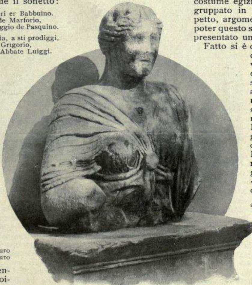
IL BUSTO DI « MADAMA LUCREZIA » IN PIAZZA SAN MARCO A ROMA.

sono i più vigili custodi delle tradizioni, vi diranno che la « grande signora Lucrezia » venne alla Corte papale di Alfonso Borgia per fare di-