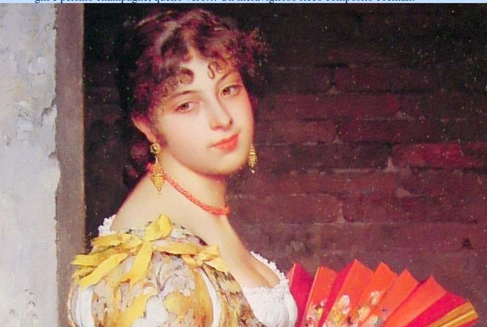
Eugenio De Blaas (1843 – 1931)

- Se non sei vino, sei certamente vermouth, strega, whisky, cognac, vodka, calvados, gin e perfino champagne, quello vero... Un meraviglioso ricco composito cocktail.