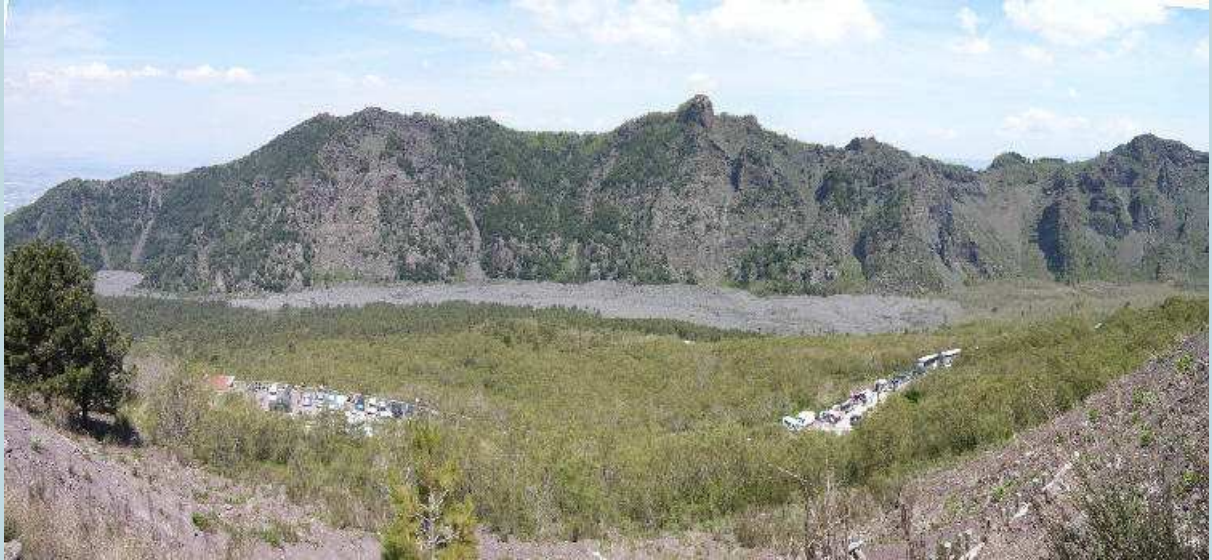
La Valle dell'Inferno con la cima del Monte Somma