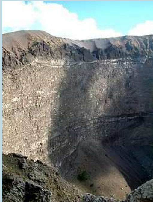
Una sezione della parete interna del Grande Cono