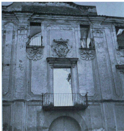
La Villa Luigi Palomba