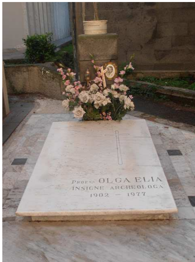
La sua tomba nel cimitero di Torre Annunziata

Nel 1977, all'età di 75 morì. La sua tomba, nel cimitero di Torre Annunziata, è sempre ricoperta di fiori.