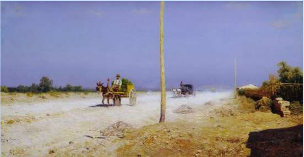
Francesco Lojacono (1838-1915)

- Sì, proprio comme dicite vuje, signurì. È accussì ca bisugnarria fargli nu monumento.