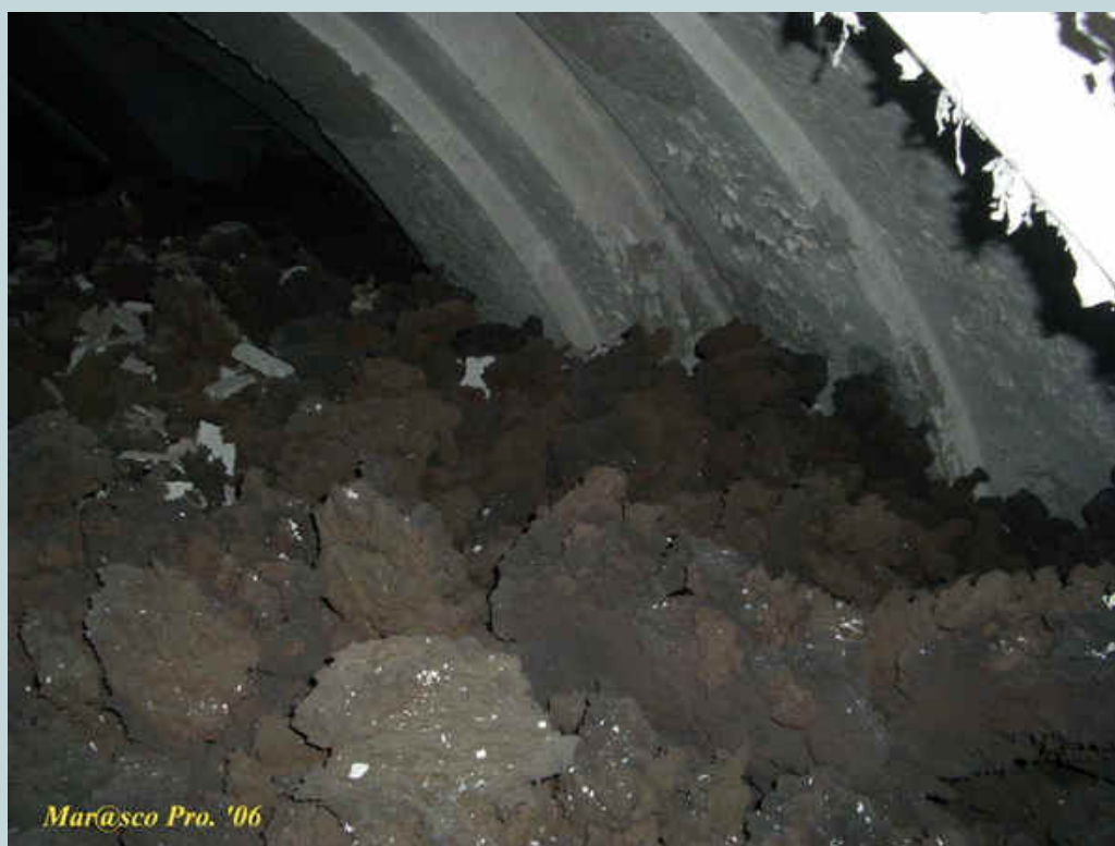
Foto 10 e 11 - Particolari delle lave interne al locale cimitero