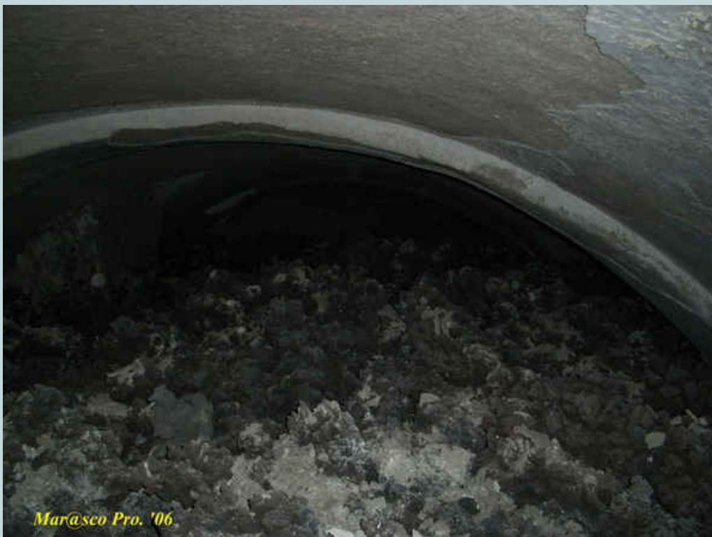
Foto 9 - Veduta del locale cimitero orientata in direzione N.E.

Il locale che mi si è presentato davanti presenta le seguenti caratteristiche: uno stanzone con il tetto a volta orientato verso Nord-Est di una grandezza valutabile sui 15 metri di lunghezza (visto da Sud-Ovest verso Nord-Est) per una larghezza massima di circa 5 metri, con un'altezza massima di circa 1,30 mt. in zona "B" (vedi rappresentazione grafica) decrescente man mano che si prosegue in direzione Nord- Est fino ad un minimo di 40 cm. per poi essere completamente ostruito.