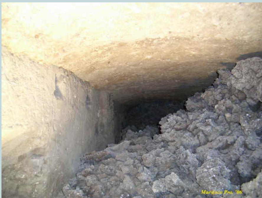
Foto 4 - Locale di accesso

Alla sinistra in basso dello stesso è possibile notare quello che resta di un accesso che immette in un locale contiguo dalle sembianze odierne non più grandi di una feritoia di circa 60 cm. di larghezza per 35 cm. di altezza.