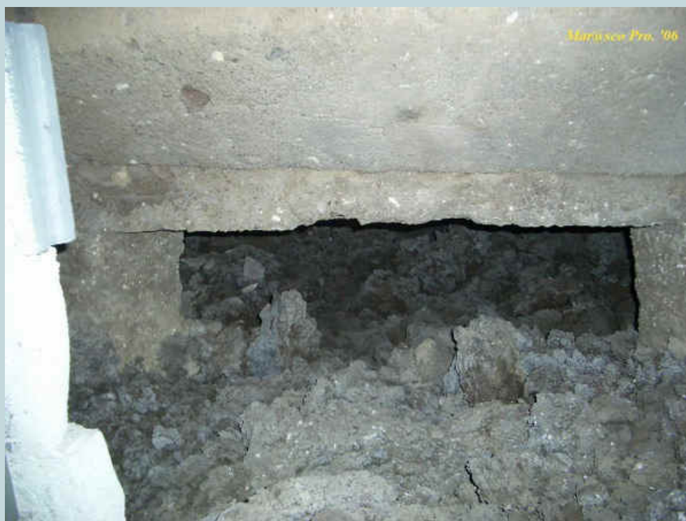
Foto 5 - particolare dell'ingresso alla camera contigua dal locale 1

Alla sinistra in basso dello stesso è possibile notare quello che resta di un accesso che immette in un locale contiguo dalle sembianze odierne non più grandi di una feritoia di circa 60 cm. di larghezza per 35 cm. di altezza.