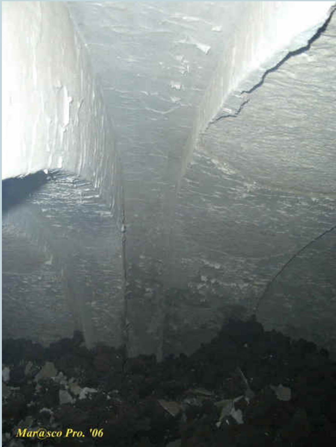
Foto 21 - Particolare delle volte della zona Sud.

Infine interessante è l'osservazione della composizione delle lave date dal loro taglio durante i lavori di ristrutturazione del locale Caritas dove si può notare la differenza delle temperature della superficie e man mano che si procede al loro interno con l'evidente parte ricca di scorie che si differenzia dalla parte interna della colata molto più compatta e fluida.