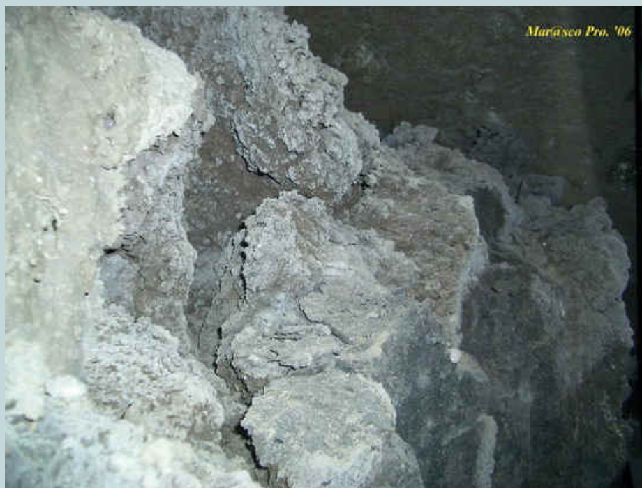
Foto 22 - Particolare rappresentato dal taglio delle lave che affluirono nei locali.