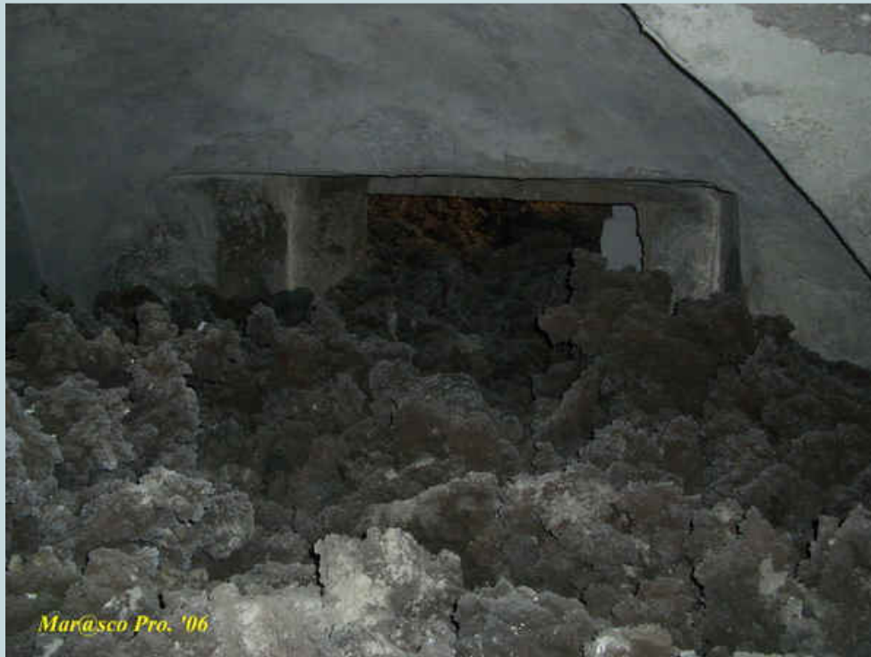
Foto 6 - particolare dell'ingresso alla camera contigua dall'interno del locale cimitero.

Devo dire il vero, valutando anche la mia statura, il passaggio dall'altra parte non è stato alquanto facile ed agiato, ma una volta dall'altra parte diciamo che un brivido di emozione l'ho provato.