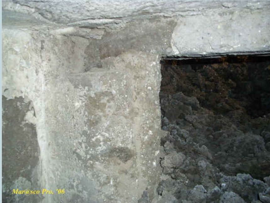
Foto 7 e 8 - Particolari interni dell'ingresso.

Il locale che mi si è presentato davanti presenta le seguenti caratteristiche: uno stanzone con il tetto a volta orientato verso Nord-Est di una grandezza valutabile sui 15 metri di lunghezza (visto da Sud-Ovest verso Nord-Est) per una larghezza massima di circa 5 metri, con un'altezza massima di circa 1,30 mt. in zona "B" (vedi rappresentazione grafica) decrescente man mano che si prosegue in direzione Nord- Est fino ad un minimo di 40 cm. per poi essere completamente ostruito.