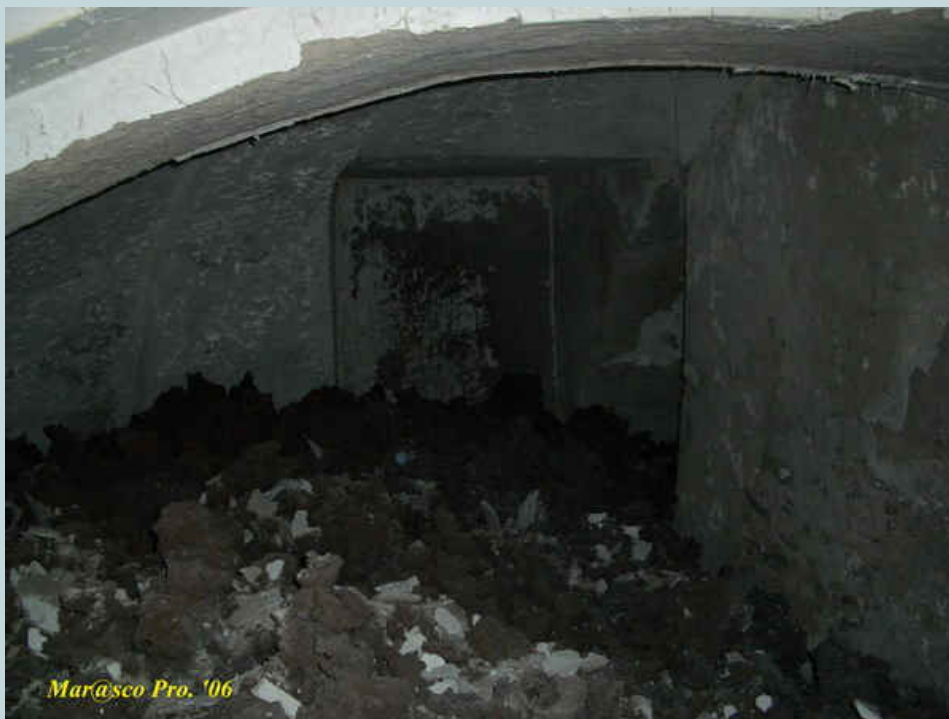
Foto 20 - Parte sud del locale, particolare del passaggio murato durante i successivi lavori di ristrutturazione dei locali.

Ancora particolari da sottolineare nella parte estrema sud del locale rappresentati da una porta, ora murata, che conduceva ai locali adiacenti allo stesso e dove in questa zona si ha la massima altezza disponibile del locale e la visuale delle volte portanti dell'intera struttura riprese come se si tuffassero nel mare igneo.