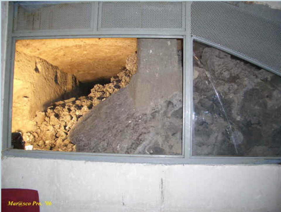
Foto 3 - Ingresso principale dei locali ripresi dalla attuale sede Caritas della Parrocchia di S. Anna.

Il locale che si vede non è di grande dimensioni, ma questo non per la sua natura in quanto esso doveva misurare circa 2,50 metri di larghezza per ben 10 di lunghezza, ma per via dell'infiltrazione della colata che per la sua metà lo ha colmato lasciando libero un piccolo e angusto corridoio non più alto di 90 cm per 1,5 mt. di larghezza all'ingresso per poi chiudersi del tutto dopo circa 4 metri di percorso al suo interno (seguì rappresentazione grafica).