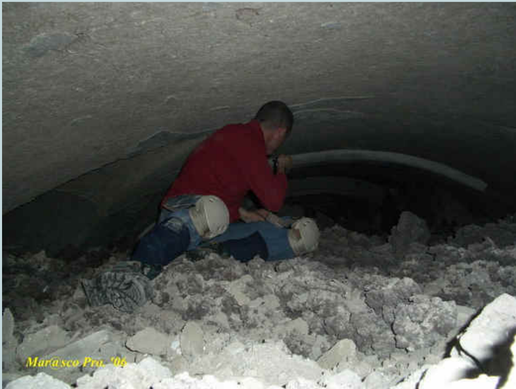
Foto 18 e 19 - Alcune immagini della concitata ricognizione.

Ancora particolari da sottolineare nella parte estrema sud del locale rappresentati da una porta, ora murata, che conduceva ai locali adiacenti allo stesso e dove in questa zona si ha la massima altezza disponibile del locale e la visuale delle volte portanti dell'intera struttura riprese come se si tuffassero nel mare igneo.