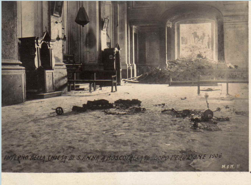
Foto 1 - Spettacolare foto ripresa dall'interno della Chiesa di Sant'Anna con in evidenza il frontone lavico che irrompe nel Tempio.

Come ben sappiamo, la colata lavica scaturita dalle bocche del Vesuvio apertesì poco sopra Boscotrecase e che invasero il centro cittadino, arrecarono gravi danni al paese circondando per intero la Chiesa di S. Anna, irrompendo al suo interno.