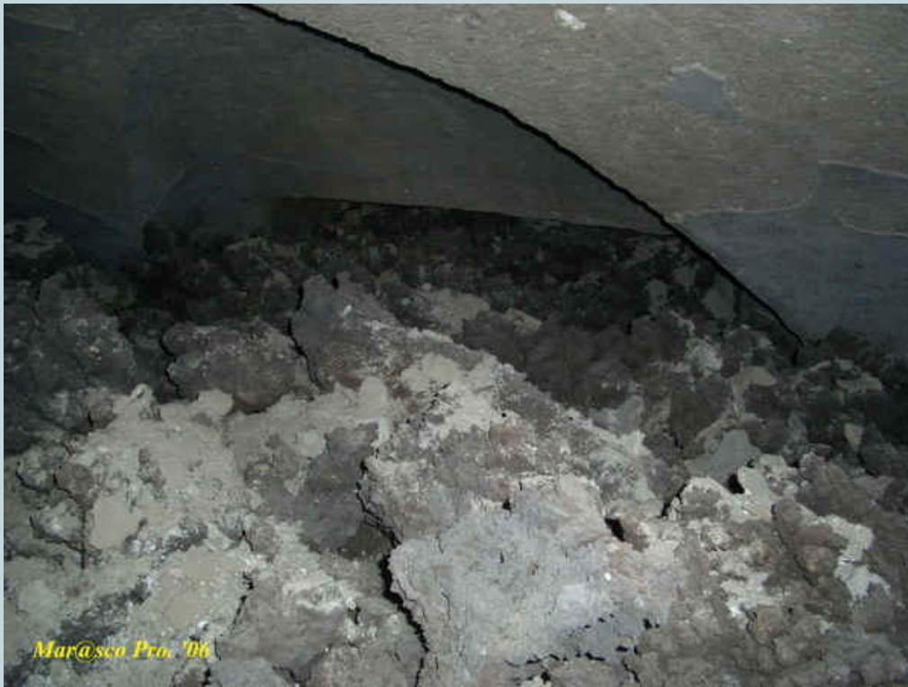
Foto 12 - Il passaggio della zona Nord del locale ostruito dalle lave

Perlustrando il cunicolo locale verso la zona Nord, sulla destra, come viene mostrato nella raffigurazione grafica, si presenta un altro passaggio, dalle caratteristiche coeve al primo, comunicante con il locale 1, completamente ostruito dalle lave e da dove sicuramente la corrente lavica che passava dal primo condotto trascinò andando ad alimentare il rivolo lavico che progrediva nel locale cimitero.