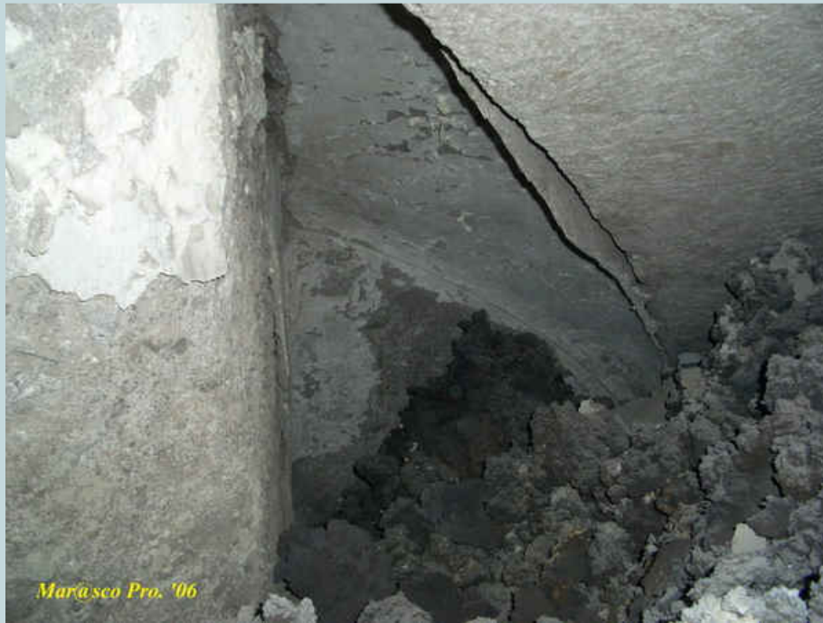
Foto 13, 14 e 15 - Particolari di uno degli elementi portanti delle volte dove si nota la bruciatura degli intonaci.

Arrivando nella parte terminale estrema nord del locale cimitero, le dimensioni dello stesso diventano molto anguste a causa dell'altezza della colata che nei pressi del punto sprofondò iniziando il suo cammino sotterraneo, ma non c'è da escludere alcuni particolari come alcune parti di architravi di pietra vesuviana forse appartenenti al vecchio portone distrutto dalle lave e ora adagiati sulla colata formando quello che oggi è una muratura creata in precedenza per ostruire il locale onde evitare alcun genere di infiltrazioni.