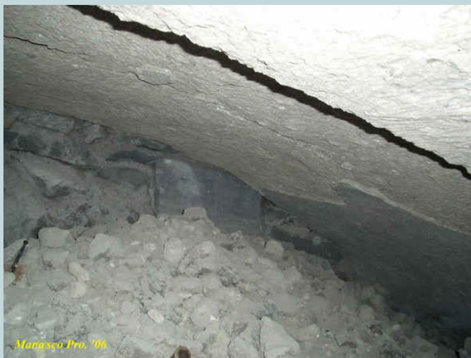
Foto 16 e 17 - Immagini della parte estrema Nord del locale cimitero.