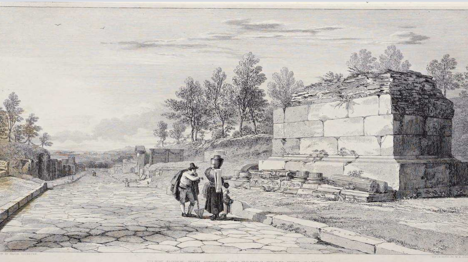
VIEW DOWN THE STREET OF TOMBS FROM THE GATE.

Dove era ora la popolosa città, la rosa variegata rinfrescata dall'ombra, e le fitte spighe ondeggianti? Gli uliveti, i vigneti, dove il mattino una volta salutava l'ampio scenario di fervido lavoro? Guarda, mentre quelle pesanti nubi lente si allontanavano lasciando visibile la cima svettante del Vesuvio, ampio dalla sua sommità alla baia sinuosa ora si stende una pianura imbiancata di cenere: una landa silenziosa, non animata da alito di vita, una tomba pallida e luccicante, un deserto di morte.