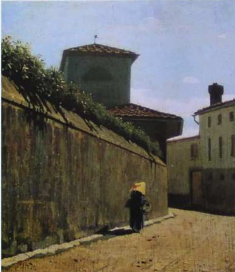
Immagine: Giuseppe Abbati (Napoli, 1836 - Firenze, 1868)

Estratto dal libro "Quasi un autoritratto del professore da giovane", OSANNA EDIZIONI, Venosa