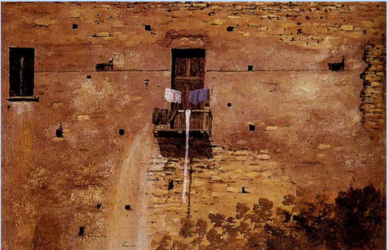
Immagini: Thomas Jones (1742–1803)