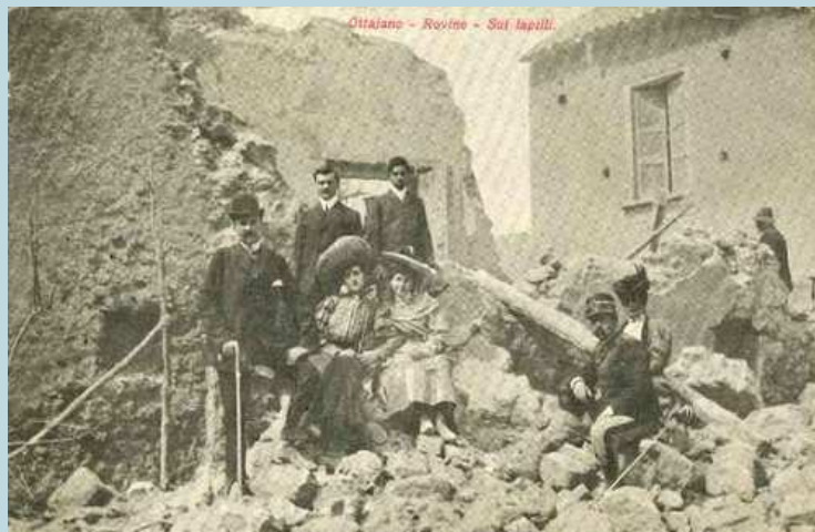
Foto 77 e 78 - Foto dei turisti sulle lave a Boscotrecase e tra le macerie delle case distrutte di Ottajano.