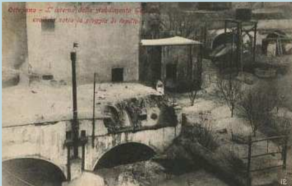
Foto 88 - Veduta di ciò che rimane dello Stabilimento Galliano presso Ottajano in una foto edita da Ettore Ragozzino (Na) nel 1906

Il Comitato elargì i sussidi dovuti non solo ai proprietari delle industrie danneggiate o distrutte, ma anche ai proprietari terrieri gravemente colpiti dalle colate laviche e alle famiglie delle vittime e dei feriti.