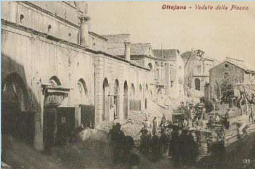
Foto 86 e 87 - I lavori di sgombero delle vie di comunicazione presso Ottajano.

Il Comitato elargì i sussidi dovuti non solo ai proprietari delle industrie danneggiate o distrutte, ma anche ai proprietari terrieri gravemente colpiti dalle colate laviche e alle famiglie delle vittime e dei feriti.