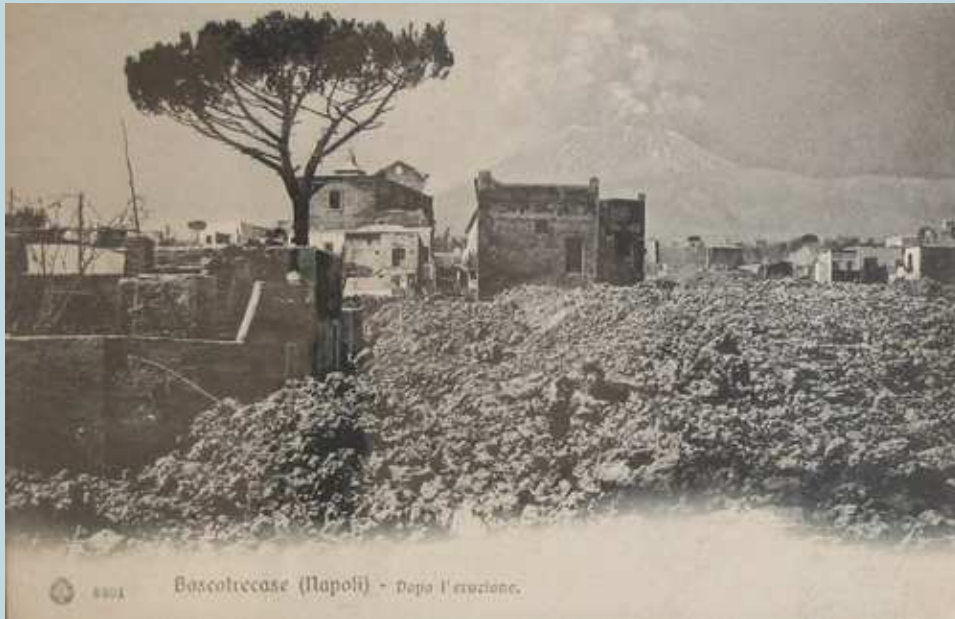
Foto 81 - La vastità della colata lavica che ha ricoperto la cittadina di Boscotrecase e come si presentava a eruzione finita. Edita dalla Richter e Co. nel 1906.

I lavori furono eseguiti in economia dal Comune, sotto la sorveglianza tecnica del Genio Civile e si riuscì a provvedervi con la spesa di Lire 45.807,37.