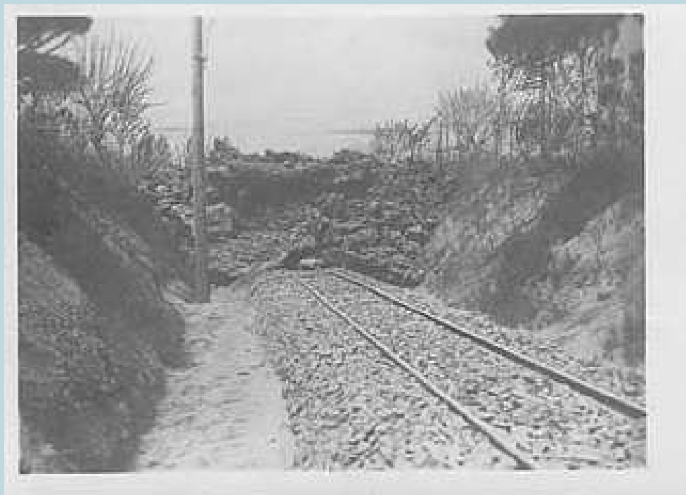
Foto 82 - La ferrovia Circumvesuviana interrotta dalle lave.