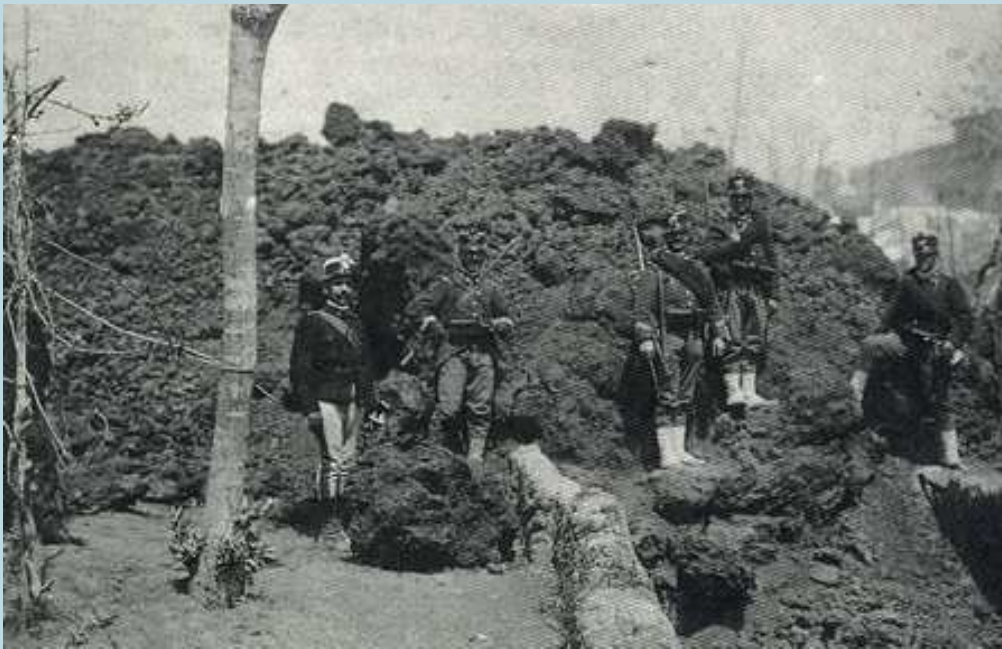
Foto 83 e 84 - L'instancabile lavoro dei soldati dell'8° Reggimento di Fanteria per sgomberare le strade di Boscotrecase dai detriti lavici e per il ripristino dei collegamenti con Torre Annunziata.

Inoltre il Comitato si preoccupò della distribuzione dei viveri di prima necessità nei Comuni colpiti e la costituzioni di cucine provvisorie dove si poteva sfamare la popolazione. Furono distribuite razioni di ogni conforto e con l'entrata in vigore della legge del 19 Luglio 1906 n. 390, si iniziarono a stanziare i fondi di sovvenzione per i Comuni danneggiati, assistenza ai profughi e alle aziende che avevano avuto danni irreparabili.