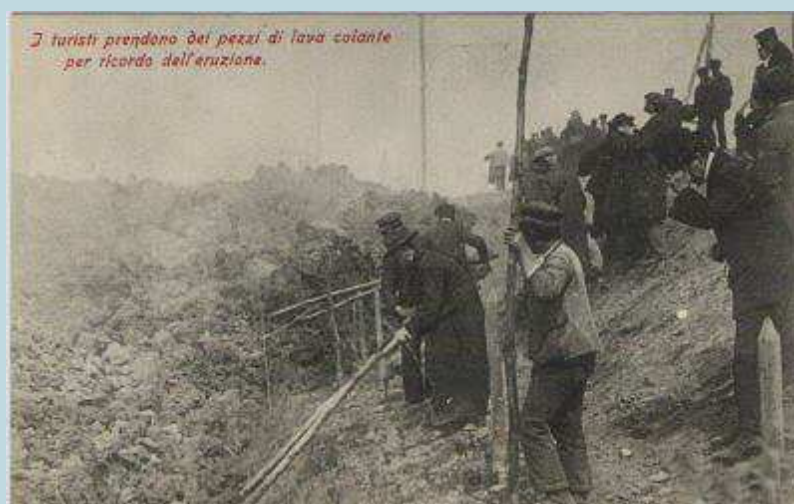
Foto 75 - I turisti facevano a gara per raggiungere le lave e portare via qualche souvenir. Foto edita da Ettore Ragozzino (Na) 1906.

E non solo questo; nei vari paesi c'era chi raccoglieva pezzi di lava ancora calda come souvenir, chi si metteva in posa tra le misere macerie delle povere case abbattute dalle ceneri vulcaniche e chi, per l'occasione, sfoggiava i fastosi vestiti dell'epoca, evidenziando maggiormente la miseria degli abitanti delle località colpite dal flagello e lo sfarzo della classe borghese dell'epoca. Anche questo evento di controtendenza venne immortalato dai vari fotografi dell'epoca che si aggiravano tra le zone devastate.