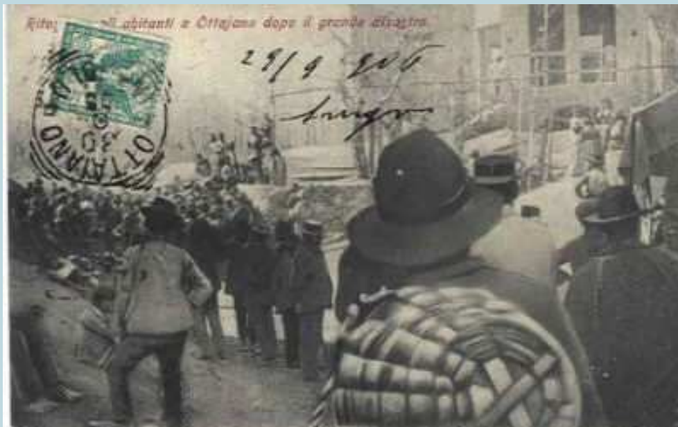
Foto 85 - I profughi di Ottajano fanno ritorno al paese

In merito ogni Ente statale si mobilitò per dare man forte; per Boscotrecase, il Ministero di Grazia e Giustizia si accollò la spesa di Lire 4.542,19 per effettuare i restauri alla chiesa della Madonna di S. Anna gravemente danneggiata.