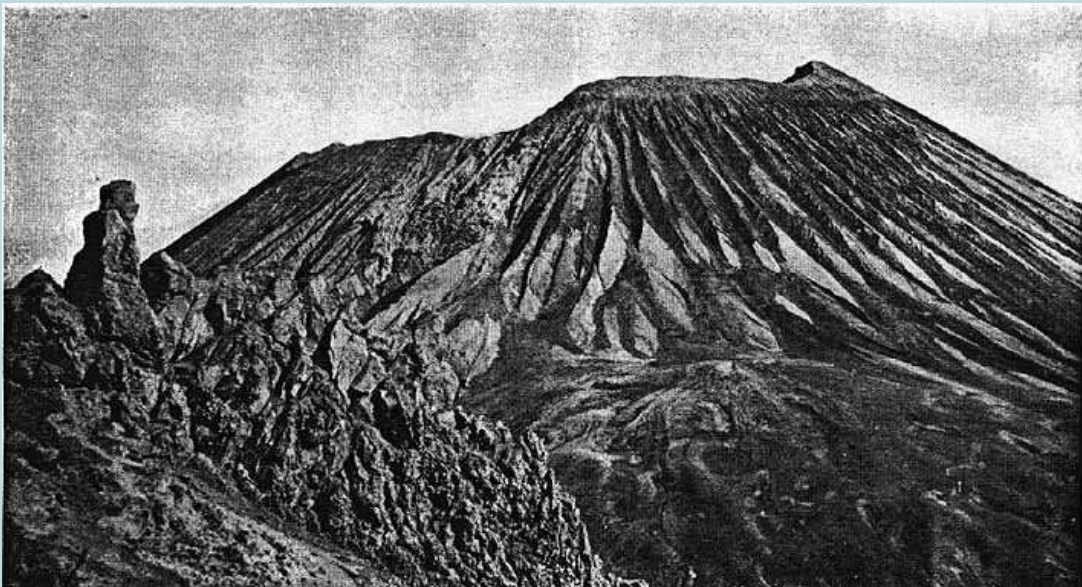
Foto 79 - F.A. Perret 1906 - Foto del Gran Cono a eruzione terminata

Il giorno 21, benché si manifestassero ancora deboli fenomeni stromboliani, l'eruzione si considerò conclusa. Il Vesuvio ora appariva, agli occhi di chi lo ammirava, assai diverso da come si presentava circa 20 giorni addietro; infatti alcuni studiosi poterono fare la seguente stima: la parte a est del cratere aveva perso circa 250 metri passando ad un'altezza di circa 1.105 metri, mentre la parte a ovest aveva perso circa 135 metri, passando ad un'altezza di circa 1.100 metri. Inoltre il cratere si presentò come un'enorme voragine raggiungendo in alcuni punti una profondità di circa 600 metri e un diametro alla bocca di circa 700 metri (secondo Fiechter I.G.M.).