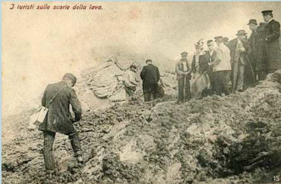
Foto 76 - I turisti facevano a gara per raggiungere le lave e portare via qualche souvenir. Foto edita da Ettore Ragazzino (Na) 1906.