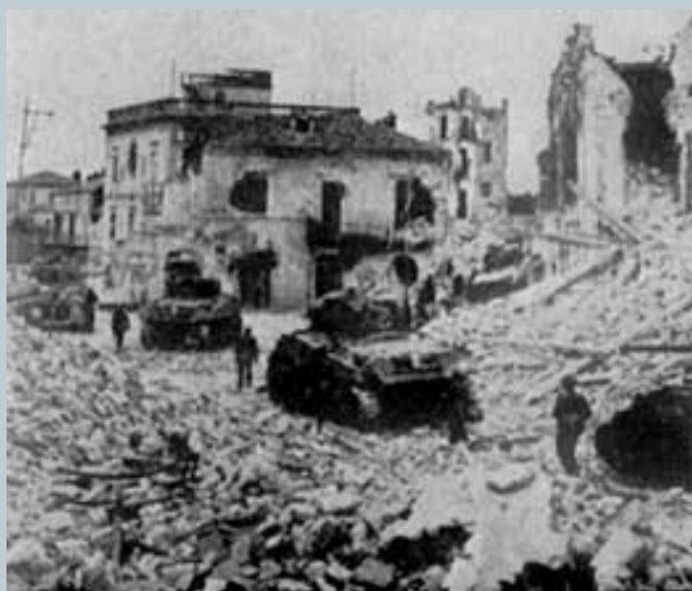
1944. La guerra continua

Abbiamo sfogliato documenti "segreti" quasi consunti dal tempo, abbiamo ascoltato superstiti e soccorritori di quel treno maledetto.